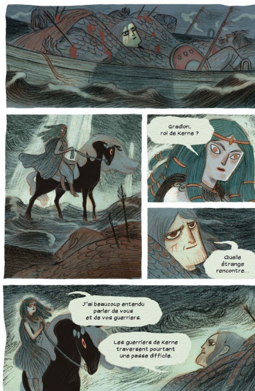
Figure 5 Rencontre entre Malgven et Gradlon - BD Soeurs d'Ys