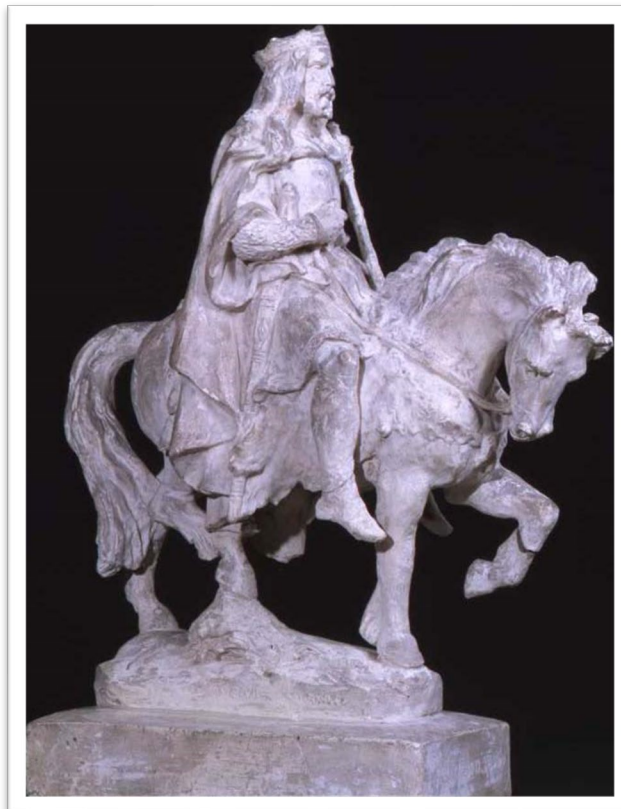
Figure 4 Le roi Gradlon avec Morvak - Musée de beaux-arts de Quimper