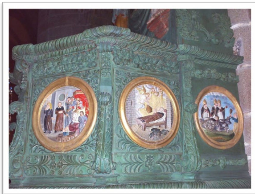
Figure 3 Images de la légende de saint Ronan - Église de Saint Ronan à Locronan