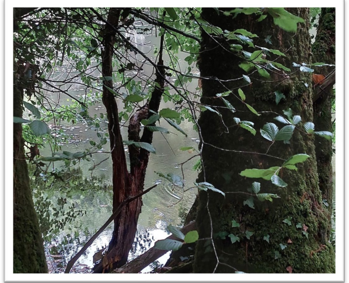
Figure 1 La Forêt de Nèvet