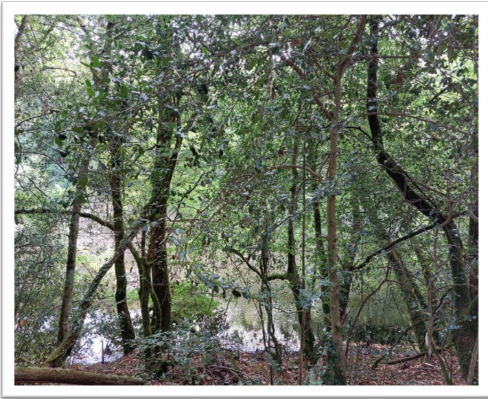
Figure 2 La forêt de Nèvet