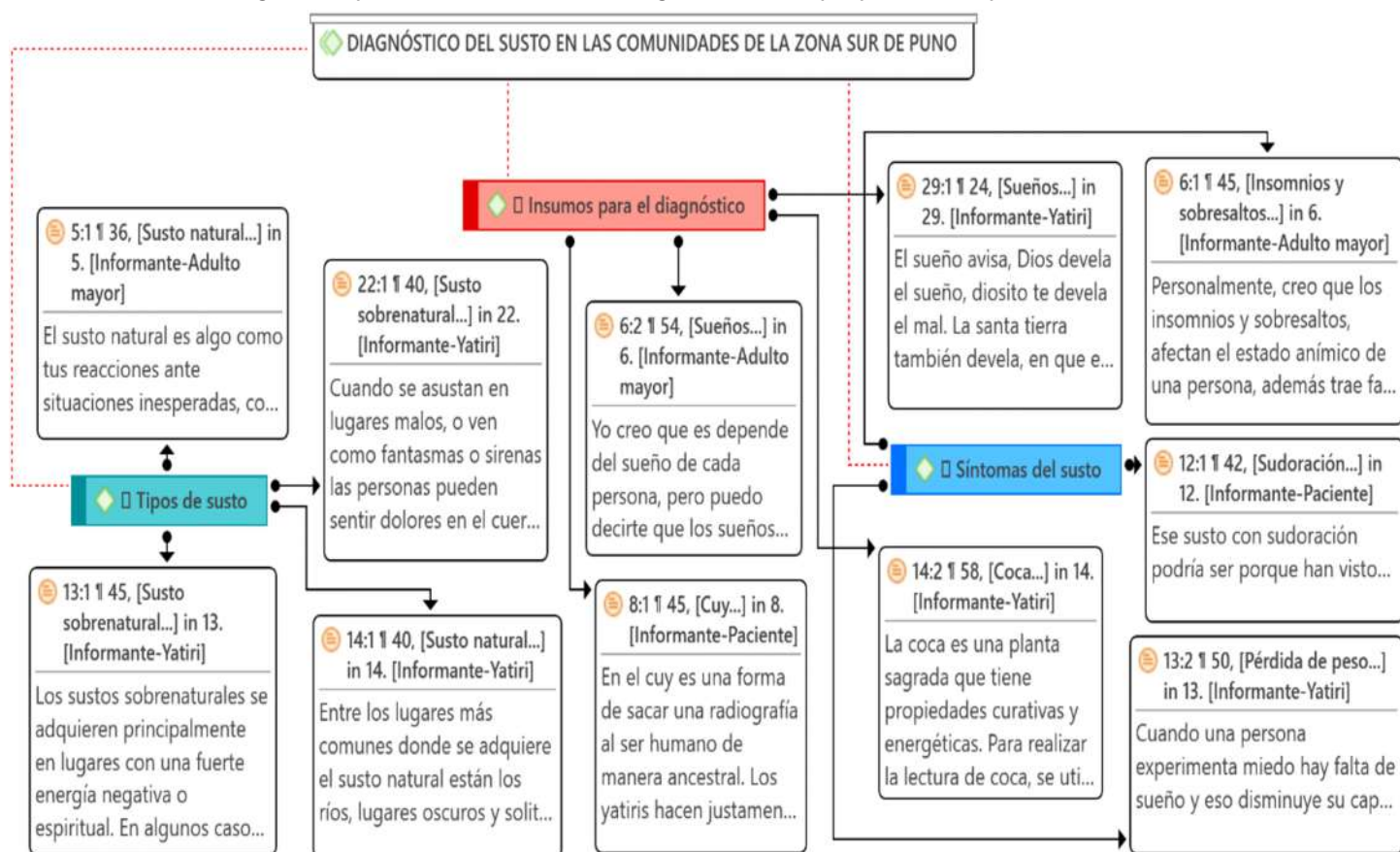
Figura 1 Red semántica del diagnóstico por naturaleza del susto según síntomas que presenta el paciente

Según Rodríguez et al. (2021), manifiesta que el susto es un síndrome cultural que recibe diferentes nombres vernáculos debido a su distribución geográfica y diversidad cultural. En la zona quechua del sur peruano, se le denomina mancharisqa (asustado) o pérdida del alma, mientras que en la zona norte del mismo contexto se le denomina pacha chari , mal de susto, en la zona aimara es denominado ajayu saraqhata (susto agarrado). Otro de los aspectos que son muy importantes para el diagnóstico del susto son los sueños, el uso de la coca y el huevo, al respecto el señor JAQ-70 años de edad manifiesta: