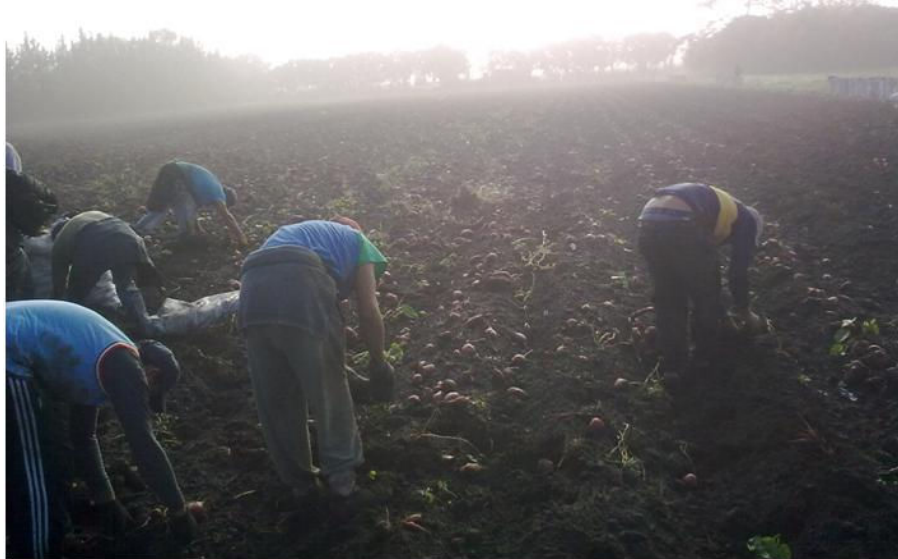
Foto1: trabajadores realizando la cosecha manual de camotes. San Pedro, Buenos Aires.

Las vestimentas que usan los trabajadores por lo general son un pantalón largo y camisas de telas variadas, el calzado generalmente son zapatillas y suelen usar gorras para la protección del sol. La protección de las manos es mediante guantes de tela con la palma engomada. No registrándose restricciones debido al calor, por la fecha en que se realizan estas actividades, en el otoño (Paunero, 2011).