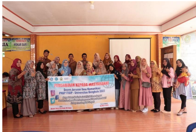
Gambar 5. Foto bersama

Tahapan selanjutnya dalam kegiatan pengabdian yang dilakukan yakni meminta peserta kegiatan untuk mencoba merumuskan bersama ide-ide terkait konten yang dapat dibagikan di media sosial official Panca Mukti. Adapun ide-ide yang akan diangkat sebagai konten atau postingan selanjutnya di media sosial (instagram) Panca Mukti yakni produk UMKM desa (olahan tape ubi), pariwisata desa (Cekdam), kegiatan posyandu, kegiatan harian desa dan profil kepala desa. Tentunya postingan tersebut akan disertai caption yang menarik dan jelas melingkupi setidaknya 3 poin dari 5W+1H (What, Where, When, Why, Who dan How).