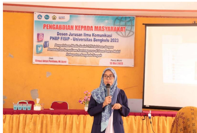
Gambar 4. Penyampaian Materi Terkait Pengelolaan Media Sosial Desa

Materi penyuluhan selanjutnya yakni terkait Tantangan Pengelolaan Media Sosial Official Desa. Tim pengabdian kemudian melakukan diskusi kepada peserta pengabdian terkait konten yang dibagikan dalam sosial media (Instagram) official desa Panca Mukti yang dapat dikatakan tidak aktif. Diketahui dari diskusi yang dilakukan, problem utamanya adalah terkait sumber daya manusia (SDM) yang mengelola. Saat ini pengelolaan media sosial dilakukan oleh sekretaris desa yang tentu saja terbatas ketersediaan waktunya untuk fokus mengurus media sosial. Mengelola media sosial membutuhkan tim yang mendukung, karena mengelola satu media sosial official membutuhkan keseriusan dalam memilih isu dan template postingan serta penggunaan bahasa dalam penyampaian pesan.