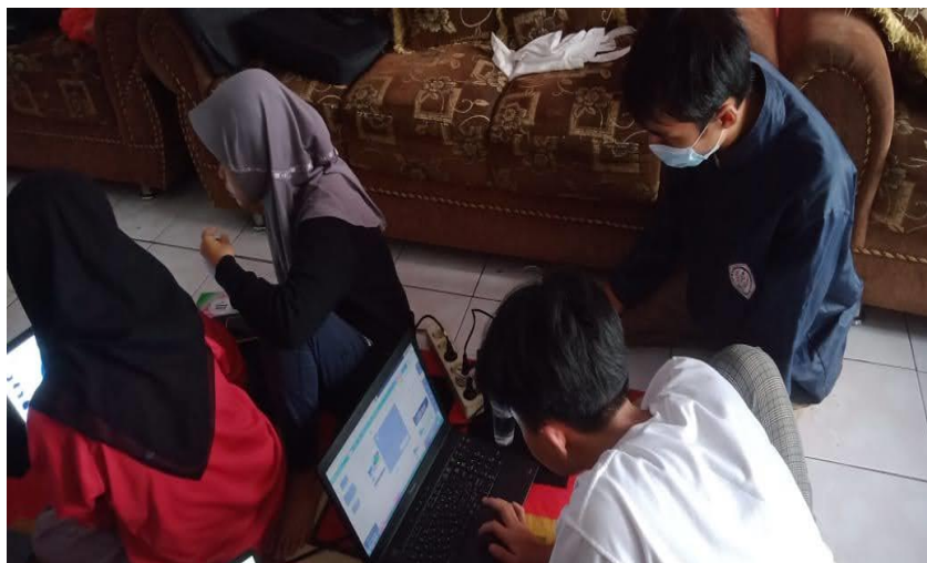
Gambar 5: Bentuk Pelaksanaan Pendampingan Ms. Office

Peserta didik tampak antusias terhadap pendampingan yang dilaksanakan. Dilihat dari keaktifan, peserta didik bertanya saat praktik. Hasil dari pendampingan ini terjadi peningkatan kemampuan dalam mengoperasikan microsoft office . Hal ini terlihat dari peserta didik yang sudah bisa membuat makalah menggunakan microsoft word , membuat presentasi di microsoft power point , dan dapat mengolah angka sederhana di microsoft excel .