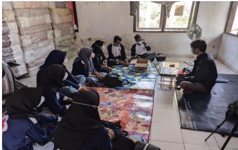
Gambar 2: Peserta Pendampingan Ms. Office

powerpoint ini agar peserta didik dapat membuat presentasi yang menarik dari tugas mereka. Presentasi yang menarik menumbuhkan minat belajar peserta didik meningkat (Resky, 2014). Kegiatan pengabdian ini melakukan pendampingan kepada 12 peserta didik mulai dari mengenalkan sampai pengoperasian microsoft office , kegiatan terlihat pada gambar 2: