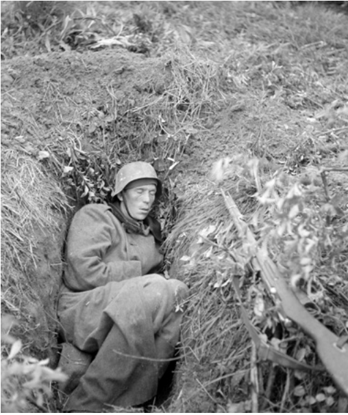
■ Kuva 1. Uupunut suomalaissotilas keskellä puna-armeijan suurhyökkäystä, Kivennapa 11.6.1944.

painajaiset muistuttivat öisiä paniikkikohtauksia ja niihin liittyi vahvoja posttraumaattisia oireita. Taisteluihin osallistumattomien siviilien keskuudessa näin suoraan todellisuudenkaltaiset unet olivat harvinaisempia ja sotaunien pääteemana oli yleensä pelko tai kokemus perheenjäsenten menettämisestä. Unien yhteys sotakokemuksiin oli symbolisempi kuin veteraanien realistisissa traumatoinnoissa. 22