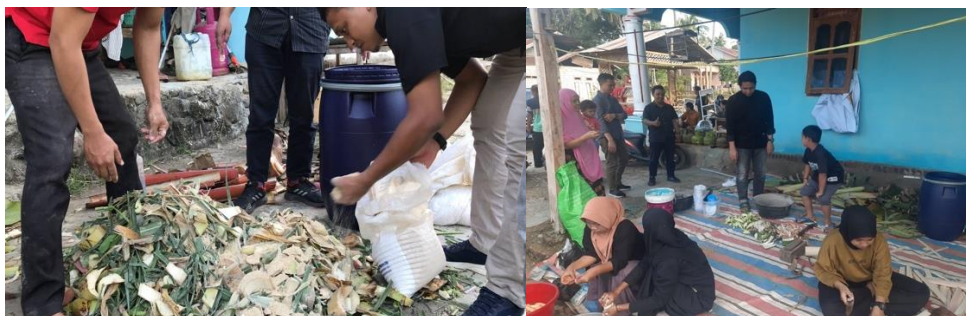
Gambar 4. Pencampuran Bahan Aditif

Proses implementasi program dalam bentuk pelatihan sekaligus melakukan pendampingan kepada mitra mengenai tata cara yang baik dalam membuat pakan silase. Antusiasme mitra cukup besar termasuk warga sekitar yang tidak hanya anggota mitra Kelompok Tani Pao Kalikie' juga dihadiri oleh ibu-ibu istri petani yang bergerak dalam himpunan Ibu PKK Dusun Pettungnge serta Kelompok Pemuda lainnya.