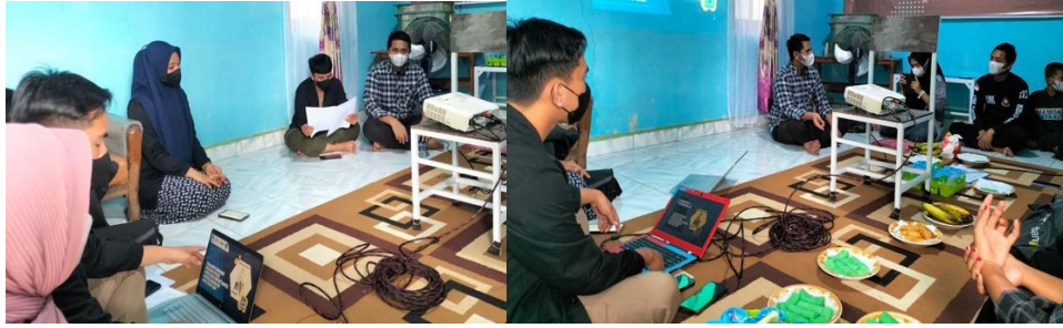
Gambar 2. Kegiatan Penyuluhan Pada Mitra

Kegiatan diskusi dengan mitra tampak anggotamitra sangat antusias dalam mengikuti jalannya diskusi sebagai bentuk focus group discussion, dimana mitra banyak bertanya sekaitan dengan masa simpan dan bahan baku selain jerami yang berpotensi pula untuk dikombinasikan dengan jerami jagung.