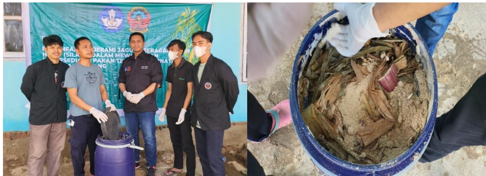
Gambar 5. Pendampingan Mitra

Pendampingan dilaksanakan untuk mengidentifikasi kondisi-kondisi yang kurang dipahami oleh mitra (dalam membuat pakan awetan hijau (silase) dengan memberikan solusi alternatif manakala permasalahan terjadi dikemudian hari. Namun, mudahnya direplikasi oleh mitra sehingga kondisi-kondisi yang menyulitkan mitra dalam memproduksi silase dapat diidentifikasi dalam kategori nihil serta memudahkan mitra dalam membuatnya sebab tidak membutuhkan waktu yang lama. Akan tetapi, hasil yang diberikan cukup memuaskan dalam memenuhi pakan ternak khususnya pada musim kemarau. Selain itu, dukungan kelompok masyarakat lainnya sangat membantu untuk mendiseminasi lebih luas pemanfaatan jerami jagung yang sangat melimpah khususnya ketika musim panen jagung tiba. Melalui pengabdian kepada masyarakat ini menjadi salah satu embrio untuk menghasilkan sociopreneur di Desa Maggenrang berbasis potensi lokal khususnya dalam mengubah limbah menjadi produk yang memiliki nilai ekonomis tinggi serta mengedepankan proses produksi zero waste.