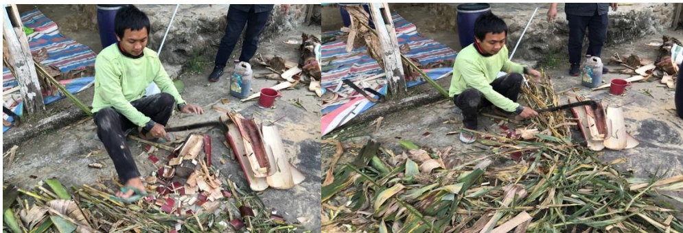
Gambar 3. Pencacahan Bahan Baku

Pelatihan dilaksanakan dalam tahapan implementasi ini dengan mengedepankan learning by doing kepada mitra (Asfar et al., 2022; Mukhsen et al., 2022) dimana mitra turut serta bersama-sama mitra melakukan pembuatan silase yang dimulai dari pencacahan bahan baku hingga proses fermentasi. Tahapan ini dilakukan pula edukasi kepada mitra terkait dengan pemilihan bahan baku yang baik serta sortasi bahan baku agar mitra mengenal bahan baku berupa jerami jagung dan tanaman hijau lainnya yang tidak mengganggu proses fermentasi, sehingga silase yang dihasilkan dapat lebih baik.