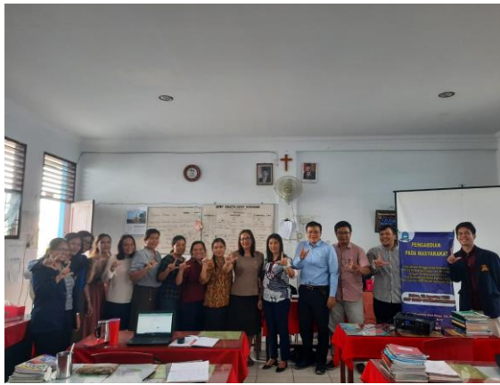
Gambar 3. Foto bersama dengan peserta Guru SMP HKBP Sidorame Medan

Dalam hari kedua, tim PkM akhirnya meng-hibahkan karya ilmiah berupa buku ajar “Pengantar Komputasi Fisika Dan Aplikasinya Menggunakan Excell” dengan ISBN : 978-623-377-824-4 Penerbit Madza Media yang merupakan Anggota IKAPI: No.273/JTI/2021 yang mana buku tersebut berisikan materi yang sudah diberikan selama sosialisasi dan pelatihan penggunaan komputasi.(S et al., n.d.)