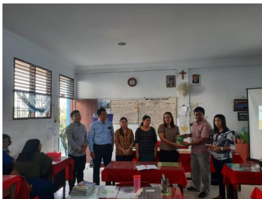
Gambar 2. Hibah Buku “Pengantar Komputasi Fisika Dan Aplikasinya Menggunakan Excel”

Hari kedua, tim PkM kembali berdiskusi dengan guru SMP HKBP Sidorame perihal penggunaan komputasi di mata pelajaran fisika dan kimia dengan Microsoft Excel. Saat diskusi, guru memberi kesan saat menerima pelatihan bahwasannya, penggunaan komputasi di mata pelajaran fisika dan matematika cukup sulit yang dikarenakan para guru jarang menggunakan microsoft excel maupun software analisis lainnya dan selama ini guru hanya menggunakan cara manual untuk kalkulasi dan ceramah selama mengajar. Namun guru yang menerima pelatihan juga menyampaikan manfaat yang sangat besar kepada guru-guru sehingga skill, informasi, dan wawasan guru mengalami peningkatan. Sedangkan untuk siswa, penggunaan komputasi ini memberikan manfaat dalam pemahaman tentang konsep dan kalkulasi yang lebih mudah diamati. Para guru juga menyampaikan terima kasih atas sosialisasi dan pelatihan singkat sekaligus meminta kepada tim PkM untuk datang kembali dan memberikan pelatihan yang lebih banyak.