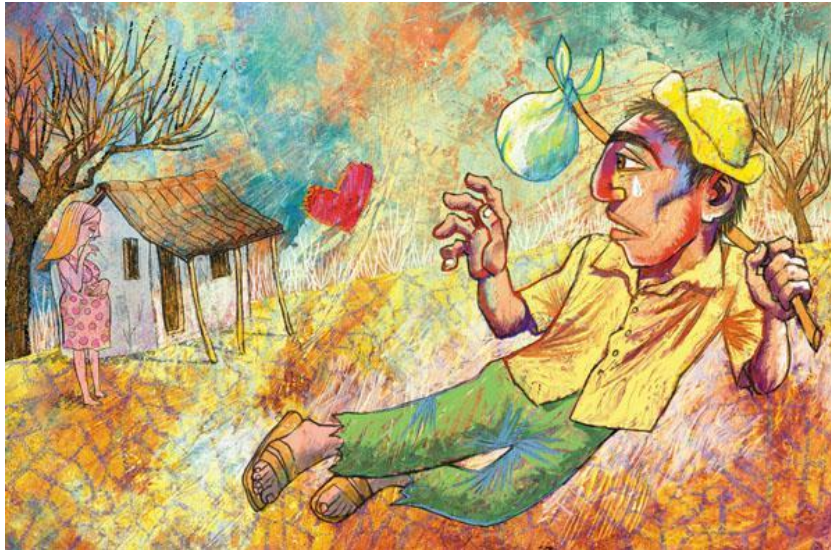
Imagem 4 – O sertanejo deixa sua família

despedindo. Na décima imagem, é a sua amada que aparece com uma lágrima nos olhos e beijando um coração.