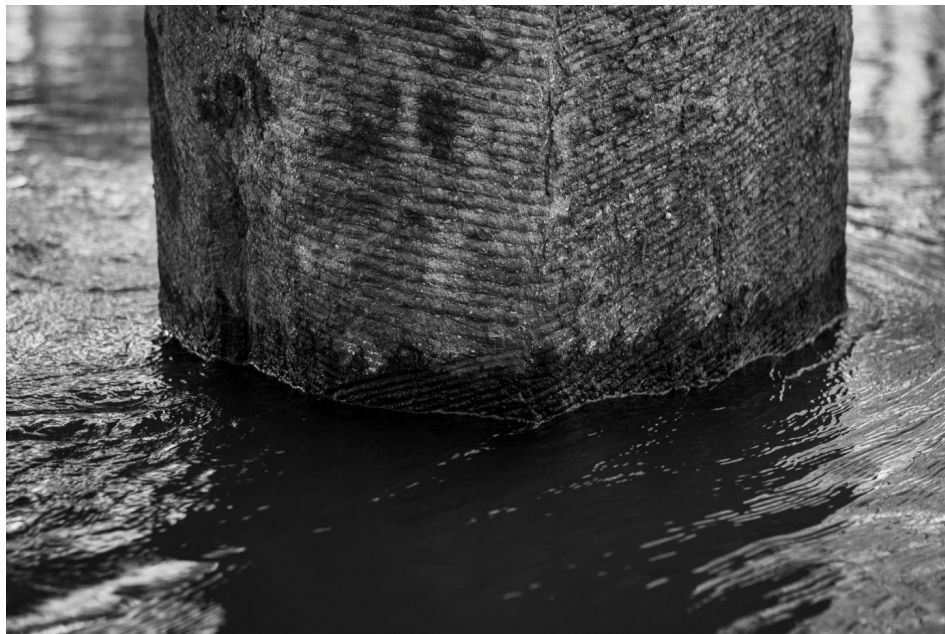
Seringueira aposentada 6