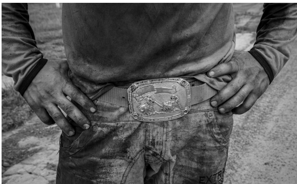
Cinturão da força 9