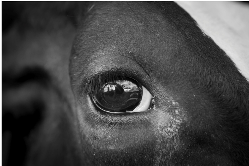
O olho, janela da alma 2