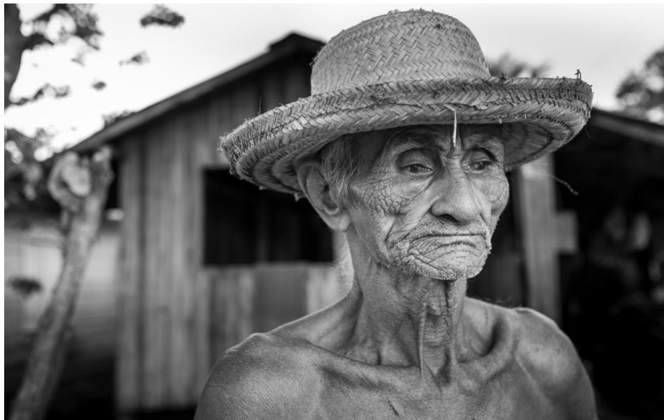
Rugas do tempo 10