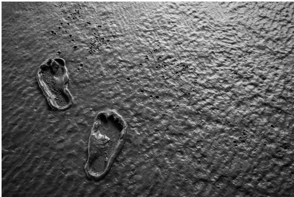
Caminhos impressos 4