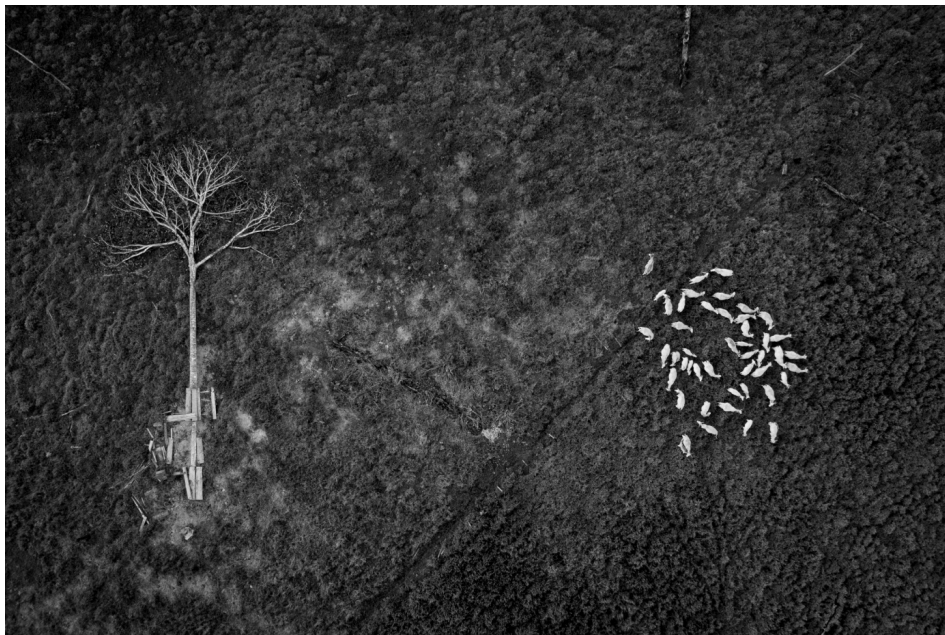
Invasão de território 8