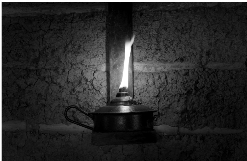
Escrita de luz 3