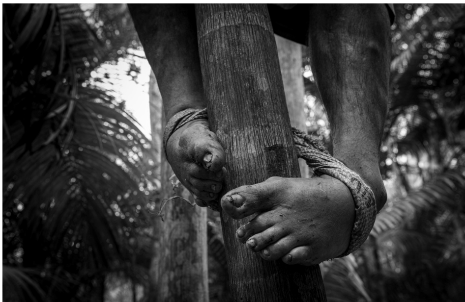
Pés para o ar 5