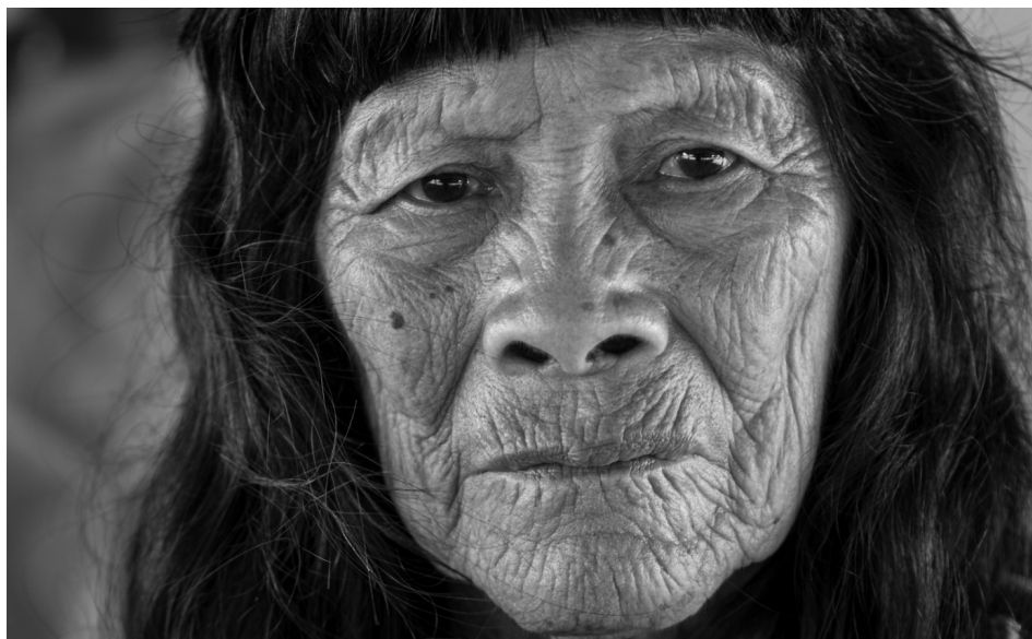
Resistência no olhar ancestral 7