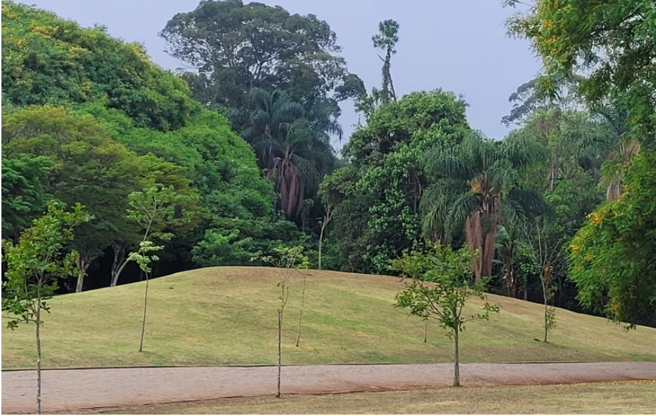
Figura 5 – Entulhos dos pavilhões encobertos pela grama. Fonte: acervo das Autoras, 2023

Também nos indicou uma grande escadaria, que mal se podia avistar de onde estávamos. Destituída de placa, nunca imaginaríamos que ali estaria mais um dos restos do Complexo. Ficamos ali um tempo, absortas pelo inesperado. Tirávamos fotografias quando um grupo de adolescentes se acercava das escadas e começava a subir. Já bastante irmanadas na flânerie , nos olhamos e entendemos que seria oportuno abordar as jovens. Uma delas, com 16 anos, conhecia os fatos, os números de mortos, e imaginava “que aquela escada poderia levar às celas”, já que terminavam em um grande corredor tracejado entre as árvores (figuras 6 e 7). Era moradora do bairro e os pais sempre comentavam aquele acontecimento.