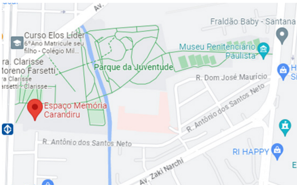
Figura 3 – Localização do Espaço Memória Carandiru.

Infelizmente, esse único lugar de preservação da memória dos pavilhões originais condicionava o acesso ao público, exclusivamente, por agendamentos por e-mail, inviabilizando a visita do frequentador comum. Durante o processo de escrita do artigo, enquanto aguardávamos uma resposta de uma possível visita ao local, descobrimos que o acesso ao espaço foi descontinuado por tempo indeterminado. No entanto, ainda nos foi possível investigar de que se tratava e como funcionava: na aba Quem Somos encontramos a informação de que seu objetivo é