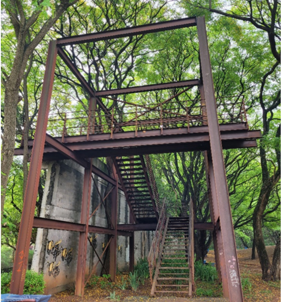
Figura 6 – Frente do Carandiru 2. Fonte: acervo das Autoras, 2023