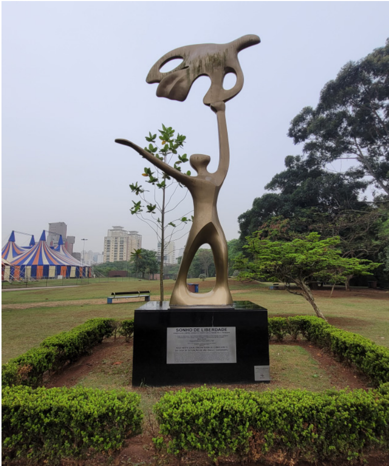
Figura 1 – Escultura Sonho de liberdade, de Domenico Serio Calabrone.

Até mesmo a placa fixada ao monumento (Figura 2) detém-se mais na explicação do combate de Mário Covas à ditadura, com reprodução de trecho de seu discurso proferido no Congresso Nacional, na sessão que antecedeu a edição do Ato Institucional n. 5 (AI-5), em 1968, do que à explicação mais pormenorizada do massacre. Em outras palavras: enquanto se tenta apagar a responsabilidade do poder público pelo assassinato de III homens, ressalta-se o perfil democrático do primeiro idealizador da desativação do Complexo.