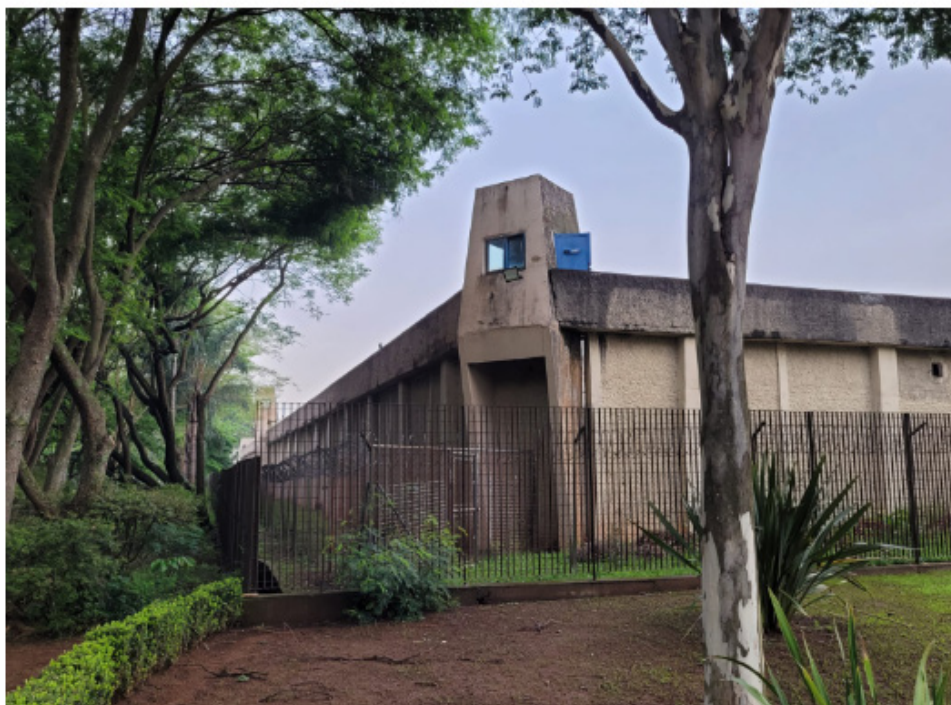
Figura 4 – Hospital Penitenciário.

Porém, informou que ali funcionava o Hospital Penitenciário, ainda em atividade por ter sido poupado na implosão (Figura 4).