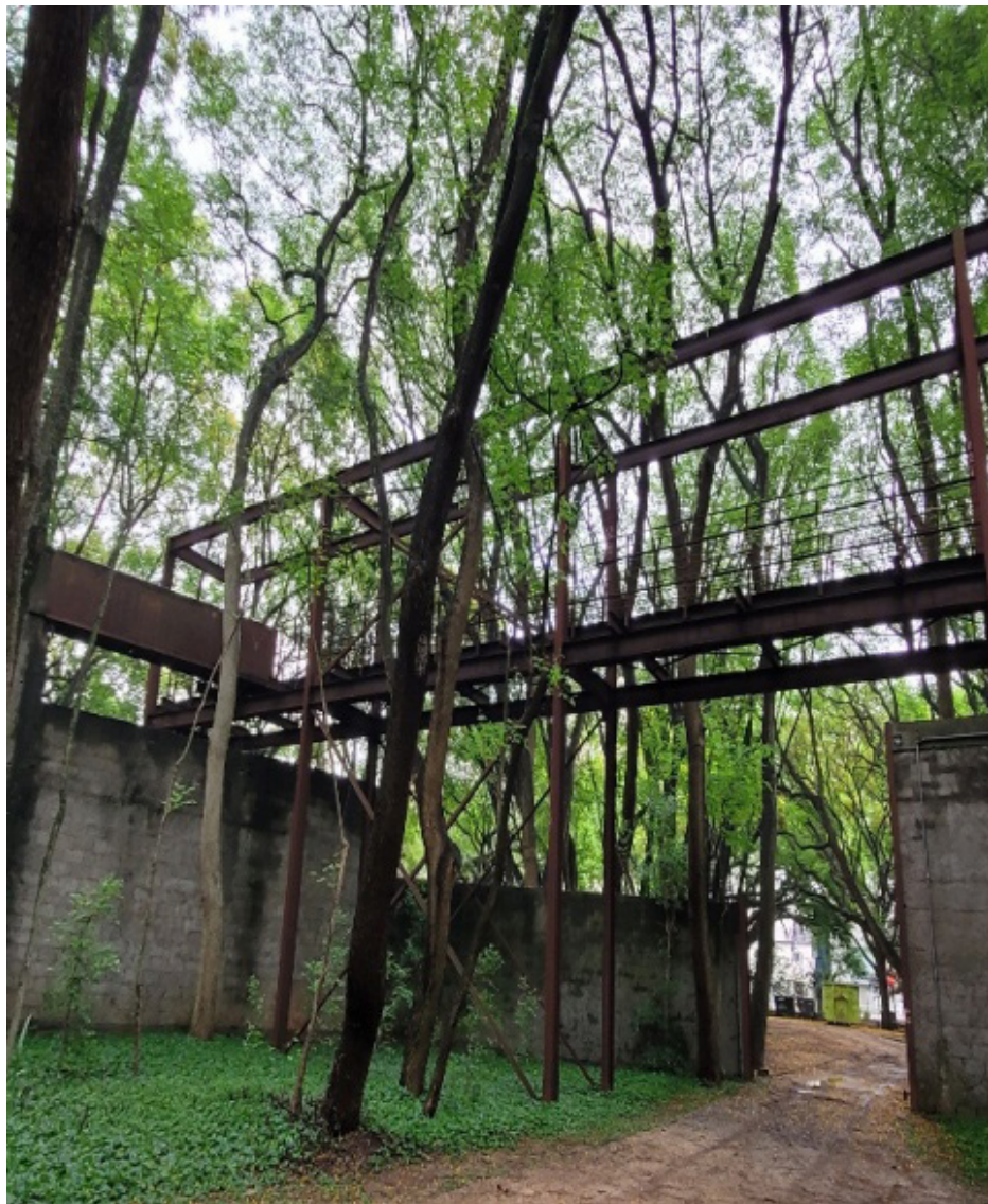
Figura 7 – Lateral do Carandiru 2.

O encontro com o grupo de três meninas que estavam se aproximando dessas escadarias nos fez perceber como sistematicamente ignorávamos as instalações do Parque. Foi apenas durante nossas pesquisas para a redação do artigo que entendemos que essa é a “única área externa do Parque dedicada a preservar a memória do local” (PEDROSO, 2021, p. 106). O que estávamos vendo teria dado origem ao Carandiru 2, em construção no início de 1990, porém a obra não fora concluída. Daquele dia em diante, nossa percepção passaria a ser outra, certamente, mais integrada ao motivo que levou uma de nós ao Parque com mais frequência nesses últimos meses: o trabalho de