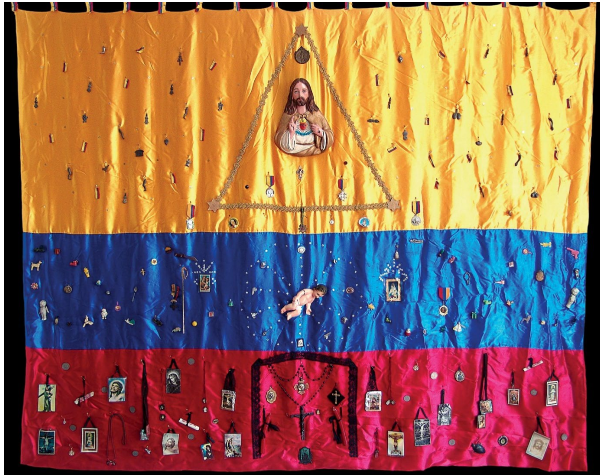
Figura 1 Identidad Nacional (1985) – Objeto Textil (bandera)

Identidad Nacional es una pieza textil que incorpora objetos comunes, cuidadosamente seleccionados por sus significados culturales y sociales, que se superpuestos a una bandera, la reconfiguran como un potente símbolo del imaginario nacional. Los referentes de este trabajo temprano están en Judith Gutiérrez 1 , Juan