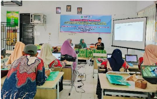
Gambar 1. Sosialisasi asesmen formatif literasi sains

Setelah materi sosialisasi, kegiatan berikutnya pada tahapan ini adalah diskusi dan tanya jawab. Kegiatan ini berjalan dengan antusias tinggi dan bermakna mengingat guru SMP Negeri 4 Langsa sebagai peserta baru mengimplementasikan kurikulum merdeka. Sehingga peserta memerlukan pengetahuan yang lebih terkait asesmen formatif literasi sains dalam implementasi kurikulum merdeka. Dalam diskusi peserta dan tim PKM menyamakan persepsi bahwa asesmen literasi sains akan berdampak baik kepada keterampilan literasi sains peserta didik. Peserta didik akan lebih terlatih dalam mengimplementasikan antara pengalaman, realita, dan konsep-konsep sains di kehidupan sehari-hari sebagai keterampilan literasi sains. Peserta didik tidak hanya menjadi pintar dalam konsep-konsep sains tetapi menjadi lebih kreatif dan inovatif mengimplementasikan konsep-konsep sains. Keterampilan ini juga dievaluasi melalui program Asesmen Kompetensi Minimum (AKM) yang dilaksanakan setiap tahun sebagai pengganti Ujian Nasional (Hanafi dan Minsih, 2022). Sehingga keterampilan literasi sains peserta