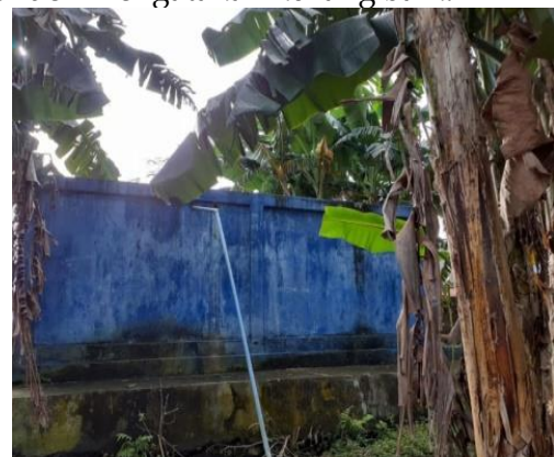
Gambar 3. Bak Reservoir

Mengenai kondisi air dari bak reservoir yang digunakan masyarakat Desa Lonthoir Kecamatan Banda Kabupaten Maluku Tengah, menurut responden 80% responden mengatakan kondisinya baik sedangkan 20% responden mengatakan kurang baik.