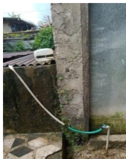
Gambar 4 Jaringan Pipa di Desa Lonthoir

Mengenai kesediaan air bersih dan distribusinya masyarakat Desa Lonthoir Kecamatan Banda Kabupaten Maluku Tengah menunjukkan bahwa 70.00% dari 7 responden mengatakan tersedia, dengan alasan mereka tinggal di dataran rendah dan dekat dengan bak reservoir, dan 30.00% dari 3 responden kurang tersedia, karena rumahnya agak jauh dari bak reservoir sehingga penyaluran air sulit untuk masuk ke daerah itu apalagi jika sudah ada warga yang mengambil air duluan.