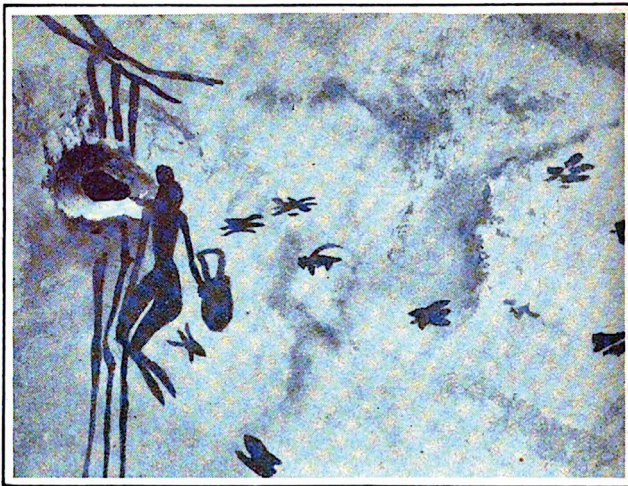
Figura 3. Revista Fray Mocho (1917).

El buscador de miel en la Edad de Piedra, según las pinturas rupestres de las covachas de la Araña, en la provincia de Valencia. El artista ha aprovechado un agujero natural de la roca para representar la colmena, alrededor de la cual vuelan irritadas las abejas.