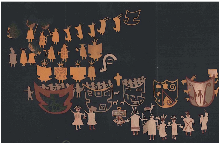
Figura 1. Lámina de Eduardo A. Holmberg en Ambrosetti (1895, entre 328 y 329).