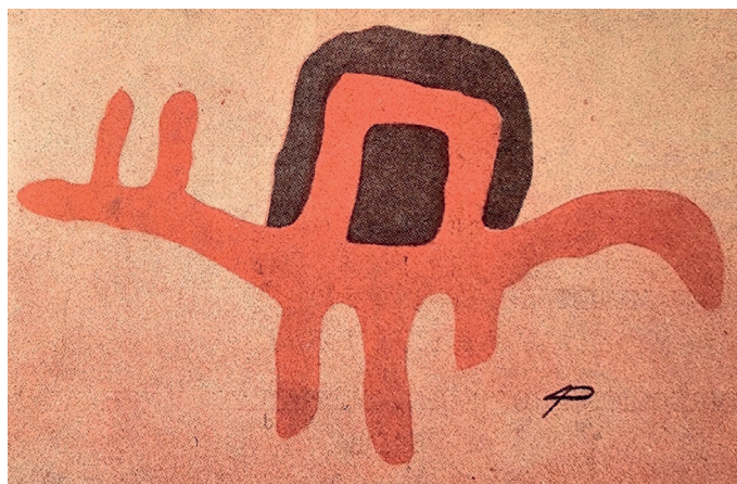
Figura 5. Reproducción de diseño rupestre con iniciales de Asbjörn Pedersen en Pinturas Rupestres de la Argentina (1960).

Paradójicamente, en la exposición un indicio pareció reunir lo escritural y lo pictórico una vez más, midiéndose frente a frente. En el catálogo, las imágenes relevadas por el arqueólogo llevaban en el borde inferior la firma 'AP'. No eran las iniciales del Apeles prehistórico, eran las del propio Asbjörn Pedersen (Figura 5). 18