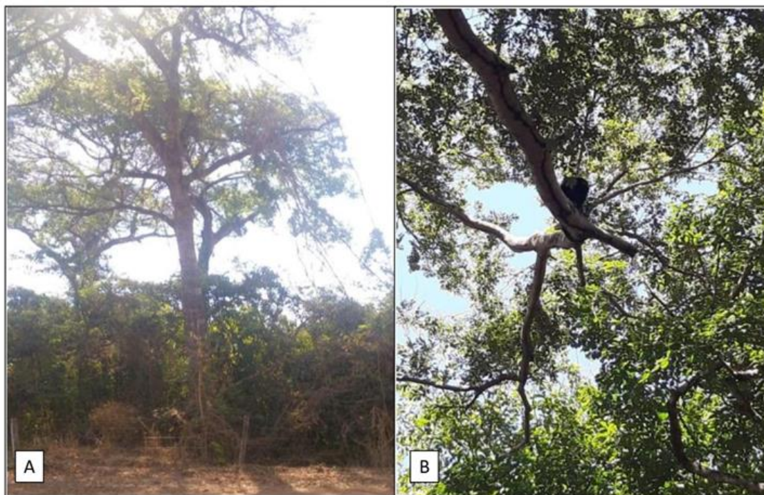
Figuras 5 (A) e 6 (B) – Árvore de altura consideravelmente grande e copa de árvore da UC.

classificado como Aw com duas estações bem definidas, chuva no verão e seca no inverno. Entre os meses de maio a setembro a abundância de água nos solos, superiores a 40mm. As precipitações apresentam média que variam de 1.500 a 1.750mm, com temperatura média anual de 23,8° C (AGÊNCIA GOIANA DE ASSISTÊNCIA TÉCNICA 2020).