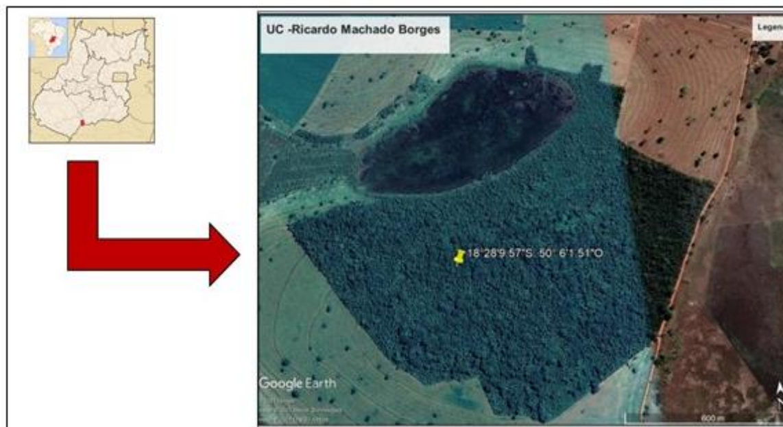
Figura 2 – Vista aérea da área da UC Ricardo Machado Borges. Coordenadas geograficas: lat: -18.28'9.57" S Lon:- 50.6'1.51" O.