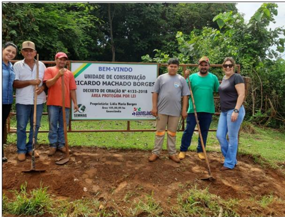
Figura 1:Local de entrada para unidade de conservação