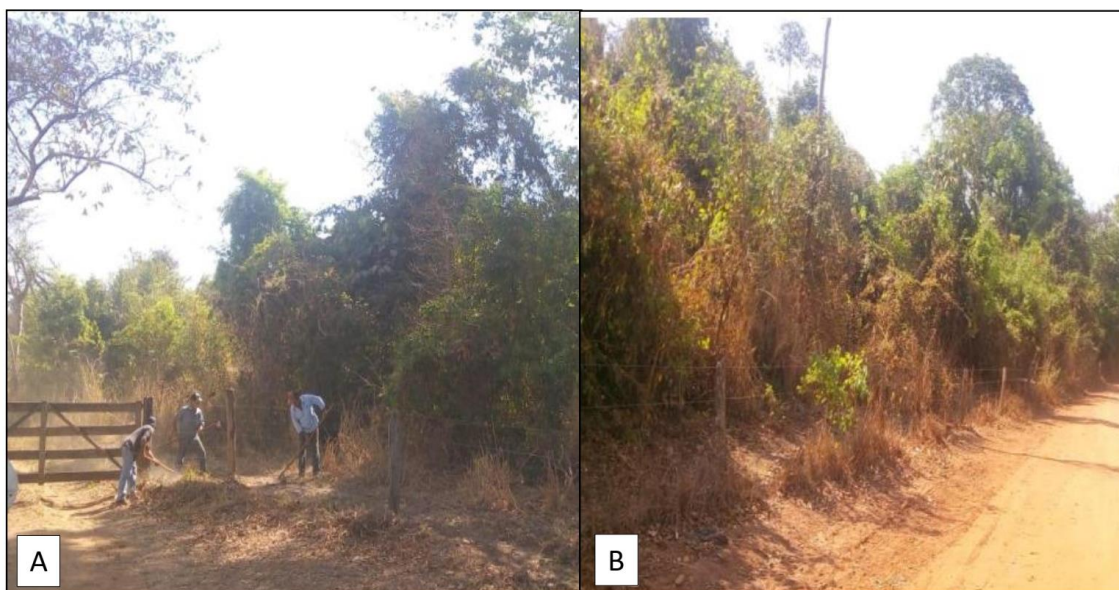
Figuras 3 (A) e 4 (B) – Manutenção das cercas.

O primeiro é os basaltos e arenitos da Formação Serra Geral, do Grupo São Bento (JurássicoCretáceo) e pelos arenitos das Formações adamantina e Marília, do grupo Bauru (Cretáceo Superior) e ainda pela cobertura detrítico-laterítica de textura argilosa. Em relação à possíveis erosões desse solo foi pesquisado que não possuem pontos suscetíveis. Por meio da criação da Unidade foram reparadas várias cercas e a construção destas em locais que não existiam, como se observa das figuras 3 e 4, a seguir: