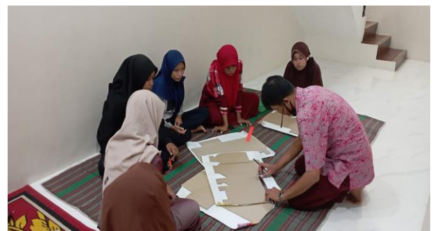
Gambar 2. Proses pembuatan pola tas kado dari bahan kardus bekas

Pada pelatihan kreasi tas kado ini ukuran tas dipilih ukuran sedang, jika ingin membuat ukuran yang lebih besar atau lebih kecil (panjang dan lebarnya) perlu diperhitungkan lagi panjang dari pola yang sudah disiapkan. Namun jika hanya ingin menambah tinggi dari tas kado maka tidak perlu merubah ukuran bagian dasar (alas) pola melainkan cukup dengan memvariasikan tingginya sesuai keinginan.