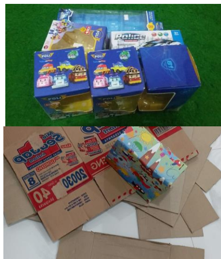
Gambar 1. Bahan kardus yang dibawa peserta untuk dibentuk menjadi kreativitas baru

kardus bekas tersebut mulai dibentuk pola, digunting dan dilem sesuai dengan tujuan akhir yang diinginkan. Adapun beberapa kardus bekas tersebut terdiri dari kardus bekas tempat mainan, kardus mie, kardus bekas minuman, susu, tempat lampu, kalender dan lain-lain. Selanjutnya, kardus-kardus bekas tersebut diubah menjadi tempat alat tulis, media belajar huruf/angka, media belajar sambil bermain (dadu) dan tirai kecil. Pada hari ketiga, peserta didik didampingi untuk membuat tas kado. Pada pembuatan tas kado, anak-anak diminta membawa kardus bekas berukuran sedang seperti kardus minuman gelas atau kardus mie yang sudah tidak terpakai di rumahnya. Bagi peserta yang tidak membawa kardus, sudah disediakan kardus bekas di tempat pelatihan. Selain membawa kardus bekas peserta juga diminta untuk membawa peralatan untuk membuat tas kado seperti gunting, silet/cutter, lem, double tape , pena dan penggaris.