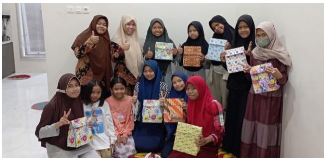
Gambar 4. Foto bersama peserta pelatihan kreativitas kardus bekas

Kreasi tas kado dari kardus bekas memiliki kelebihan dan kekurangan masing-masing. Kelebihan tas kado dari kardus ini lebih kuat dibandingkan dengan tas kado yang terbuat dari karton atau kertas kado saja. Adapun kekurangannya adalah dalam proses pembuatannya (memotong dan melipat) lebih sulit karena lebih tebal dibandingkan dengan tas kado yang terbuat dari karton atau kertas kado. Selain itu saat menempel kertas kado pada kardus menggunakan lem juga diperlukan perkiraan agar kertas kado tidak robek saat ditempel karena terlalu banyak lem atau tidak menempel karena terlalu sedikit lem. Kreasi dari bahan kardus bekas ini dapat diaplikasikan sebagai bentuk mengasah tingkat kreativitas peserta didik.