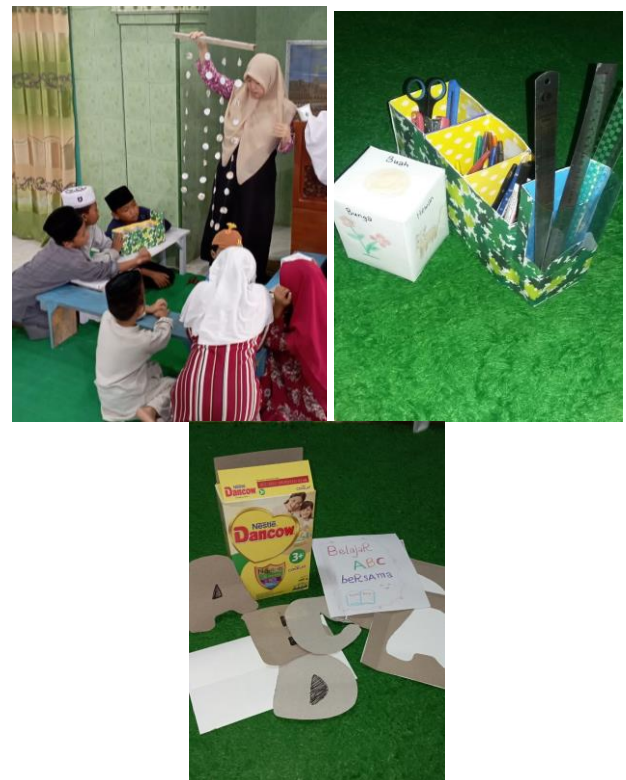
Gambar 5. Hasil kreasi bahan kardus bekas sebagai ragam permainan untuk anak usia dini

Hasil dari kegiatan pengabdian ini menunjukkan bahwa pemanfaatan kardus bekas dengan metode 3R ( Reduce, Reuse, Recycle ) mampu mengurangi volume sampah kardus bekas hingga 30%, meningkatnya pemahaman peserta didik tentang pentingnya kebersihan lingkungan yang terlihat dari perilaku peserta didik yang sebelumnya acuh terhadap kebersihan di sekitarnya serta munculnya ide-ide kreatif peserta didik terkait pemanfaatan kardus bekas untuk dijadikan bentuk kreasi lain selain yang sudah diajarkan. Kegiatan pengabdian ini dievaluasi setelah 3 bulan dari waktu berakhirnya pengabdian. Instrumen evaluasi yang digunakan adalah tes (tertulis, lisan dan perbuatan) dan nontes (observasi, sikap dan angket). Tujuan evaluasi ini untuk mengetahui tingkat keberhasilan (keberlanjutan) kegiatan yang sudah dilakukan, meningkatkan efektivitas serta pertimbangan keputusan yang akan diambil selanjutnya.