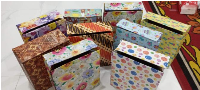
Gambar 3. Hasil kreasi tas kado

yang sudah ada disalin pada kardus yang sudah dipotong memanjang tersebut. Pola yang sudah disalin pada kardus kemudian dipotong dengan silet/cutter agar lebih rapi kemudian ditempelkan pada kertas kado. Kertas kado dipotong kembali menyesuaikan bentuk pola yang sudah ditempel sebelumnya dengan memberikan jarak berlebih sekitar 2 cm dari kardus agar kertas kado dapat dilipat dan ditempel kembali pada kardus. Selanjutnya tempel bagian sisi kardus yang terbuka agar tertutup dan terbentuk tas yang diinginkan. Kardus yang sudah berbentuk tas ditekan ditengah pada bagian atas dari sisi kanan dan kiri tas agar nampak lebih menarik. Selanjutnya kreasi tas kado dari kardus bekas sudah siap dipakai. Setelah tas kado diisi dengan hadiah, bagian ujung tutup tas kado dapat ditempel dengan double tape agar menutup dengan rapat.