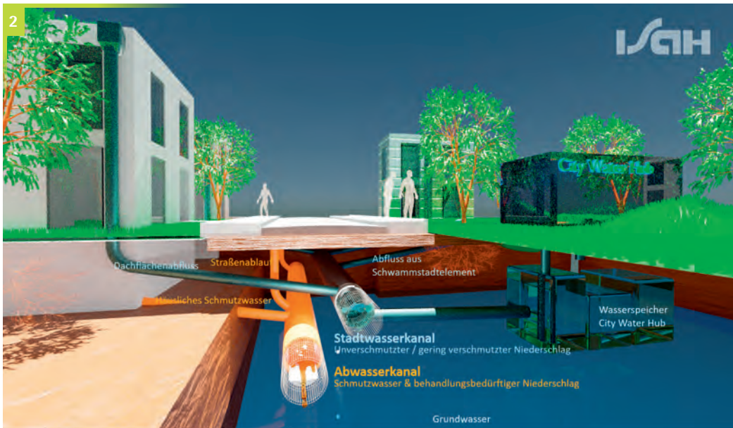
Abbildung 2 Kanal-Infrastrukturen im Stadtwasserkonzept

Im Abwasserkanal werden Schmutzwasser und behan- lungsbedürftiges Regenwasser (zum Beispiel von Verkehrsflä- chen) gesammelt und im vor- handenen Entwässerungssys- tem (Schmutzwassersammler) einer Behandlung zugeführt (vgl. Abbildung 3 ). Das erzeugte Schmutzwasser wird auf (zentralen) Kläranlagen behandelt, die leistungsfähige Abwasser- reinigungsverfahren vorhan- den und eine Belastung der Oberflächengewässer wirk- ungsvoll und stabil verhin- dern. Die Auswirkungen ver- änderter Zulaufbedingungen wurden in den genannten For- schungsprojekten in ersten Ansätzen untersucht und sind weiter zu überprüfen.