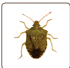
El chincheapestoso consperse Euschistus conspersus