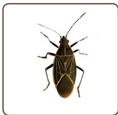
El chincheboxelder Boisea rubrolineata