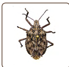
El chincheapestoso áspero Brochymena sulcata