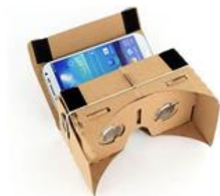
Figura 3 – Google Cardboard Glasses com smartphone acoplado.

Essa iniciativa está diretamente ligada à redução dos custos desse dispositivo, possibilitando a sua incorporação nas aulas do ensino básico e tornando o processo educativo mais dinâmico. Isso resulta em aulas de Geografia menos abstratas que atraem os jovens para discussões envolventes sobre diversos temas da disciplina.