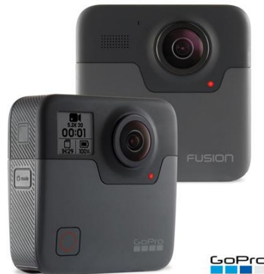
Figura 1 – Câmera GoPro Fusion.

microfones distribuídos em toda a estrutura, proporcionando um sistema de áudio de 360° capaz de registrar sons de várias direções sem conflitos.