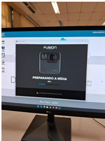
Figura 3 - Mídia sendo carregada para edição dos vídeos em 360° no aplicativo.

Geografia e Planejamento Ambiental (DGPA) da UNESP de Rio Claro para as edições (Figura 3), uma vez que a plataforma exige certa capacidade de memória física (RAM) para executar o aplicativo.