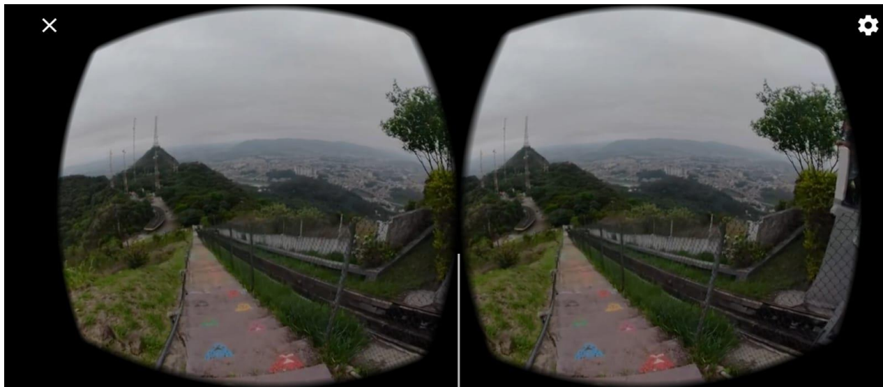
Figura 5 - Visualização duplicada para óculos VR no YouTube.

Estes vídeos, em razão de seu formato 360°, possuem a opção de visualização duplicada para utilização em óculos VR no YouTube (Figura 5). Foi por este motivo a escolha da plataforma para upload dos vídeos propostos para aplicação em sala de aula, dado que o aplicativo em questão está presente na maior parte dos smartphones, o que facilita o trabalho com os estudantes no ambiente escolar.