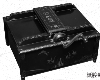
紙腔琴（伊福部昭旧蔵）

表面写真 左：自宅書斎にて（2000 年頃） 右上：指揮をする伊福部昭（年代不明） 右下：因幡万葉の歌五首手稿譜表紙