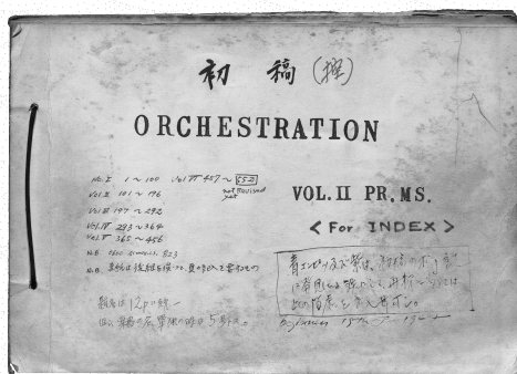
『管絃楽法』下巻初稿の校正用原稿