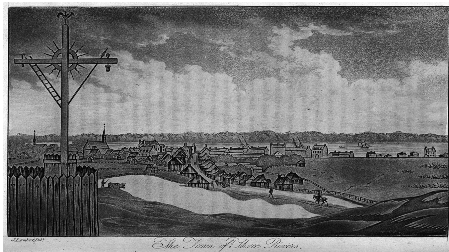
Trois-Rivières à l'époque de la magistrature de Pierre Bédard, un bourg qui se développe lentement

industrielles du pays 50 . À Trois-Rivières, on a construit quelques années auparavant une prison et un palais de justice, les ursulines y tiennent une école depuis 1697 et les Trifluviens sont fiers de leur église centenaire dédiée à Notre-Dame-de-l'Immaculée-Conception et qui sera richement restaurée et décorée en 1818.