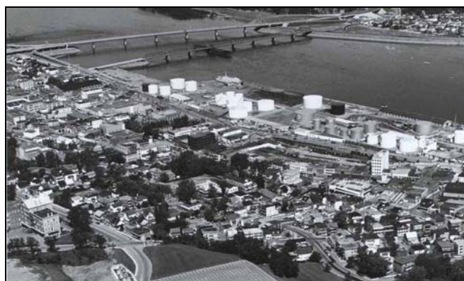
Fig. 2 – Utilisation du sol au centre