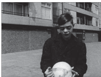
Fig. 8: L'enfant aveugle , 1964, 24 minutes. Édition intégrale, Johan van der Keuken, vol. 3, chez Arte France Développement, Ideale Audience International, Pieter van Huystee film, 2007.