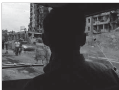
Fig. 4: Amsterdam Global Village , 1996, 229 minutes. Édition intégrale, Johan van der Keuken, vol. 2, chez Arte France Développement, Ideale Audience International, Pieter van Huystee film, 2007.