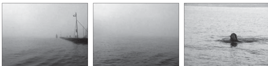
Fig. 2: Amsterdam Global Village , 1996, 229 minutes. Édition intégrale, Johan van der Keuken, vol. 2, chez Arte France Développement, Ideale Audience International, Pieter van Huystee film, 2007.