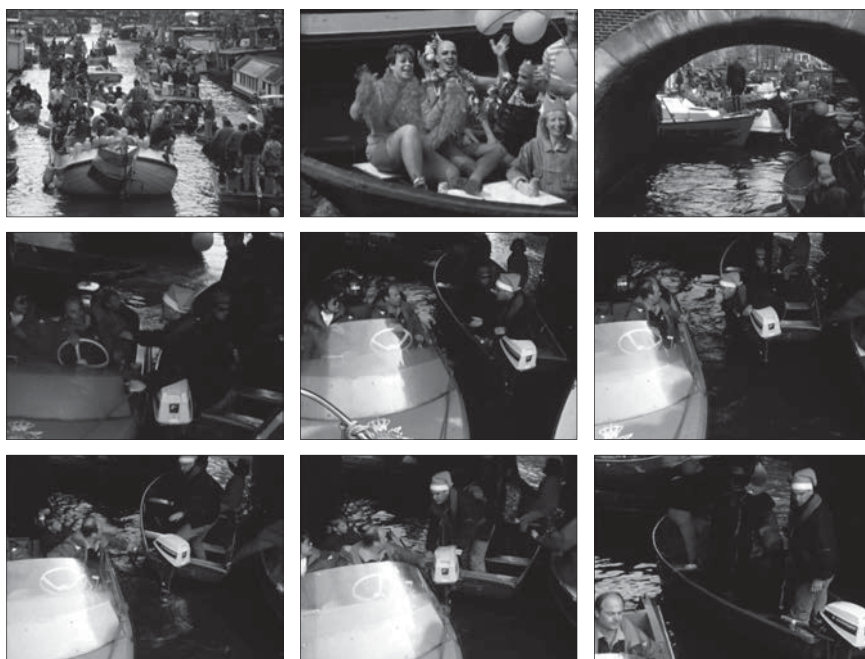
Fig. 3 : Amsterdam Global Village , 1996, 229 minutes. Édition intégrale, Johan van der Keuken, vol. 2, chez Arte France Développement, Ideale Audience International, Pieter van Huystee film, 2007.

le geste presque enfantin (arroser l'autre) est tout en retenue. Les deux hommes, dont les bateaux ne s'écartent pas malgré leur désaccord, se contiennent, pour quatre raisons essentielles : l'impossibilité de fuir eut été un échange plus violent ; le rythme imposé de la cohabitation lente à laquelle oblige la navigation sur le canal encombré ; la présence du collectif autour d'eux, un jour précisément de célébration rituelle de la communauté ; l'internalisation d'un point de vue « tiers » sur la situation qu'ils vivent et dont ils doivent sortir, qui leur permet de trouver une alternative (la pichenette d'eau) sans « perdre la face » selon l'expression bien connue de Goffman encore 6 . Or ces quatre raisons qui empêchent l'altercation sont à la fois extrêmement contraignantes et incroyablement fragiles. La violence (finalement) contenue de la scène et la tension qu'elle engendre rendent sensible, par la menace de sa perte, la civilité ordinaire qui fait tenir un monde commun.