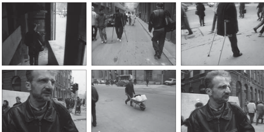
Fig. 10: Sarajevo Film Festival Film , 1994, 14 minutes. Édition intégrale, Johan van der Keuken, vol. 2, chez Arte France Développement, Ideale Audience International, Pieter van Huystee film, 2007.

Au tout début de Sarajevo Film Festival Film , on emboîte le pas à un inconnu, à travers des couloirs sombres. Arrivé dans la rue, l'inconnu s'arrête, la contemple en silence tandis qu'on – cinéaste, spectateur, passant – le dévisage. Mais une voix hors champ, la sienne, s'insinue et raconte le quotidien de la ville, la peur de la déambulation, la méfiance des uns envers les autres. Van der Keuken ose alors des allers-retours interrogatifs entre le personnage immobile au milieu de la rue qui paraît songer à la perte du commun, dont nous entretient sa voix en son hors champ, et les passants affairés, qui transportent eau et nourriture avec une diligence inquiète. L'arrêt du personnage, les allers-retours indécis de la caméra, et l'écoute de cette voix intérieure, font de ce moment de côtoiement et de partage de l'espace civil une sorte de miracle, tel que peut encore l'offrir le cinéma – comme pratique d'interaction tout autant que comme espace imaginaire de sociabilité 11 – à cette ville en guerre.