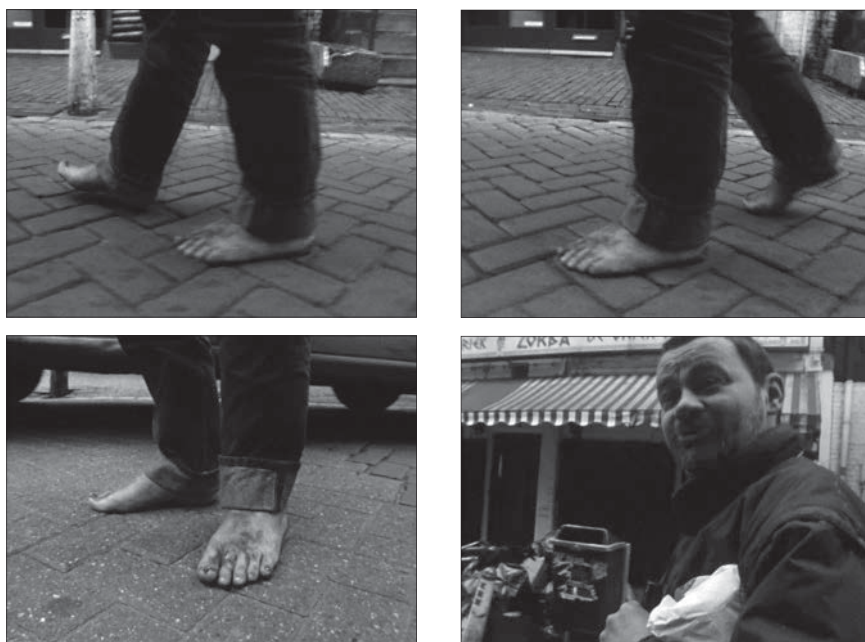
Fig. 6: Amsterdam Global Village , 1996, 229 minutes. Édition intégrale, Johan van der Keuken, vol. 2, chez Arte France Développement, Ideale Audience International, Pieter van Huystee film, 2007.

de son visage, néglige l'enregistrement de sa parole, ne cadre que ses pieds. Le montage crée une impression d'allégresse : le cinéaste semble virevolter autour du clochard et la scène se clôt sur le sourire complice de ce dernier, heureux de son personnage d'homme aux pieds nus, né d'une rencontre impromptue. L'interaction a créé une scène pour que l'exposition publique – subie plus souvent qu'autrement par les sans-abri – génère ici au contraire, en quelques plans, le plaisir partagé du spectacle entre filmeur, filmé et spectateur.