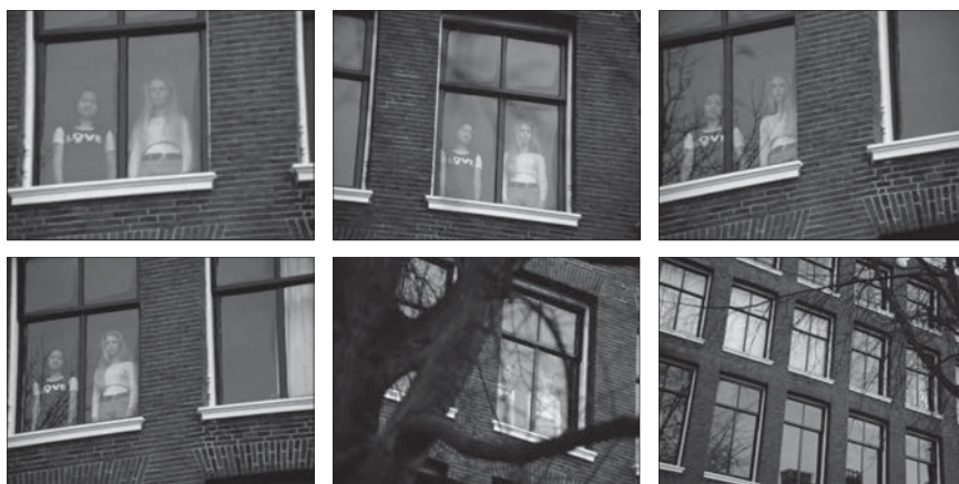
Fig. 1: Amsterdam Global Village , 1996, 229 minutes. Édition intégrale, Johan van der Keuken, vol. 2, chez Arte France Développement, Ideale Audience International, Pieter van Huystee film, 2007.

Ainsi, dans Amsterdam Global Village (1996), les longs et lents travellings pris des canaux de la ville se présentent explicitement comme des expériences de co-présence et de partage du temps. Être dans le temps, c'est s'éprouver dans et avec le monde qui s'instaure dans la perception. Le travelling ne dit pas uniquement la durée de la chose qu'il montre, mais la coexistence de ce qui existe avec celui qui le perçoit. Longueur et lenteur des travellings ont pour fonction de retarder le point de rupture qui établit la séparation du voyant et du vu. Le sentiment d'appartenance se bâtit alors sur le lien entre le corps sensible qui voit et les choses vues qui l'entourent. Mais cet abandon a pour destin d'être contrarié : l'apparition d'un visage qui vous toise affecte soudain la fluidité du mouvement. C'est ce qui arrive dans cette séquence où les travellings pris au fil de l'eau, sur les façades d'Amsterdam, sont interrompus par la présence de deux femmes à leur fenêtre, qui suivent la caméra du regard. L'échange de regards avec ces deux femmes inaccessibles dans la clôture de leur espace intime demeure indéchiffirable. Le mouvement bute sur leur apparition comme sur un écueil dans l'écoulement du temps, reprend et répète la rencontre. La série de faux raccords de mouvement qui se produit alors accentue le sentiment de rupture, exprime le hiatus qui rompt le charme de la contemplation.