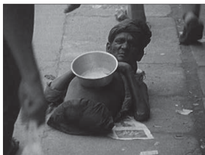
Fig 9 : L'œil au-dessus du puits , 1988, 90 minutes. Édition intégrale, Johan van der Keuken, vol. 1, chez Arte France Développement, Ideale Audience International, Pieter van Huystee film, 2007.