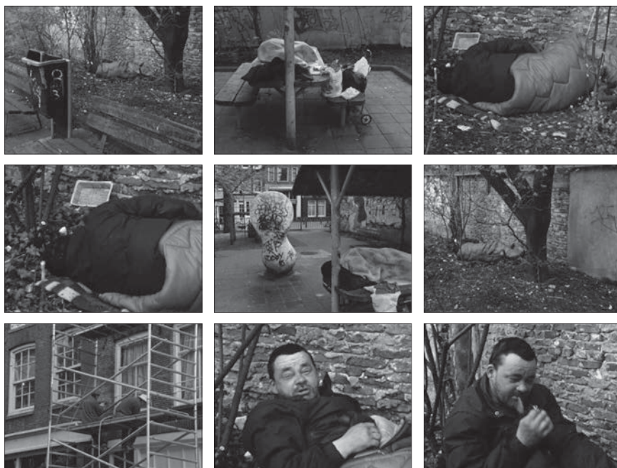
Fig. 5: Amsterdam Global Village , 1996, 229 minutes. Édition intégrale, Johan van der Keuken, vol. 2, chez Arte France Développement, Ideale Audience International, Pieter van Huystee film, 2007.