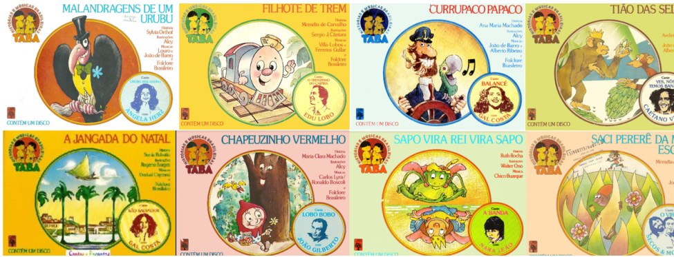
Figura 1: Capas dos fascículos n.ºs 15, 17, 10, 04, 21, 39, 02 e 14

A fotografia do artista da MPB, estampada na capa de cada fascículo (Fig. 1), e certamente endereçada para os adultos, opera como um estímulo afetivo e um selo de qualidade musical experimentada no passado. A canção “de boa qualidade” pode ser oferecida para as novas gerações como uma alternativa à ascensão da música pop que, na década de 1980, coloca em xeque o valor e a circulação da MPB e da cultura nacional.