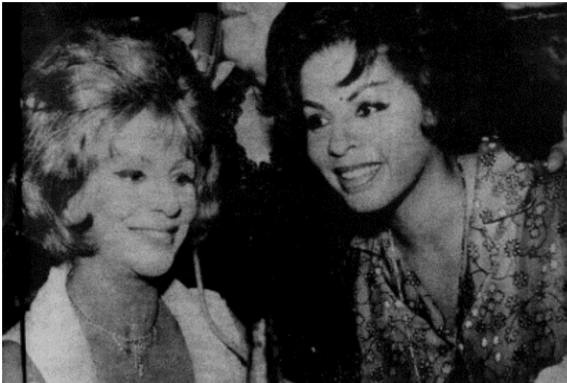
Figura 4 - Reportagem do retorno de Dalva de Oliveira, depois de um acidente de carro em 1965, entre as amigas cantoras que lhe queriam bem, uma delas, Angela Maria, (Nº 861, p. 29, 19/03/1966).

o seu irmão reconheceu sua voz e contou a sua mãe. Os programas de calouros davam prêmios financeiros e o que Ângela ganhou eram valores bem maiores que o de tecelã ou na fábrica de lâmpadas (Faour, 2015).