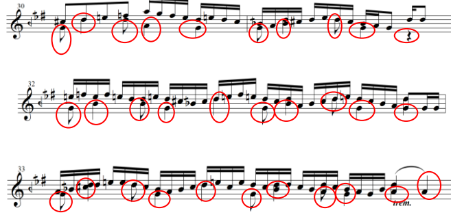
Nota 13: Suzinak taksim ritmik icra örneği.

zorlanmasına neden olmuştur. Yeni karşılaştığı böylesi bir icrayı, öğrenci ilk çalışmalarında yadırgamış ve uygulayamamıştır.