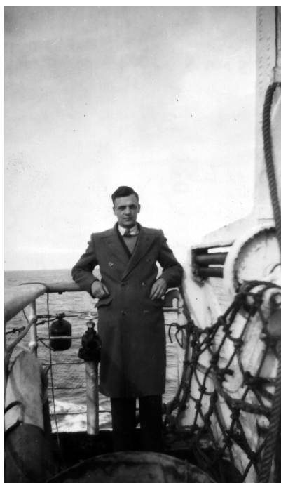
André Laurendeau en route pour la France, photographié en septembre 1935 à bord de l' Alaunia .

Les Jeune-Canada sont à leur apogée lorsque le jeune André Laurendeau publie Notre nationalisme en octobre 1935 ; ils se sont alors donné, après trois ans d'existence, la doctrine qui semblait tant leur avoir fait défaut. Mais Laurendeau est à Paris depuis le 24 septembre lorsque le tract paraît fin octobre. Il fait le voyage, en pleine crise économique, sociale, politique et spirituelle, pour y poursuivre des études en sciences sociales auprès d'André Siegfried à l'École libre de science politique et en philosophie auprès de Jacques Maritain à l'Institut catholique. Il y fait aussi, plus ou moins consciemment, l'apprentissage du métier de journaliste comme en témoignent ses visites à de nombreuses figures de mouvements politiques et sociaux, ses entretiens, ses