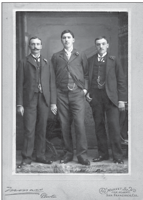
4. Trois jeunes Béarnais posant en costume de « Messieurs ».