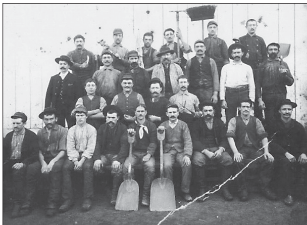
3. Personnel béarnais de l'abattoir de San Francisco. Fonds AMMÉ (détail).