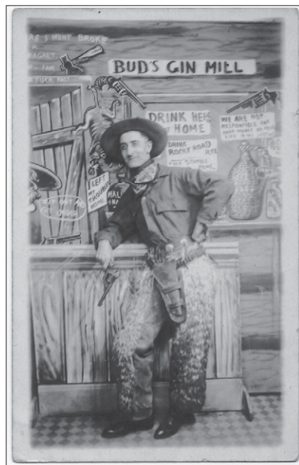
5. Béarnais costumé en cow-boy.