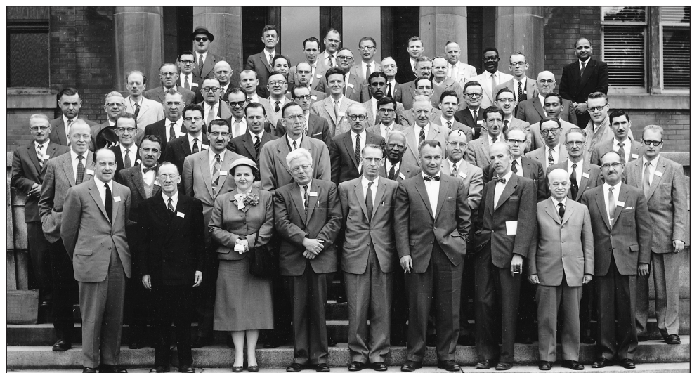
Figure 1a. Réunion annuelle 1958 de la SPPQ, tenue au Collège Macdonald (50 e anniversaire).