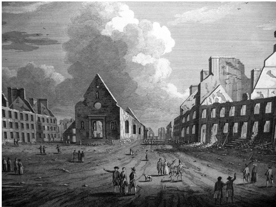
Ruines de l'église Notre-Dame des Victoires et de la Place Royale à Québec (détail). Paru dans Thomas Jefferys, The Natural and Civil History of the French Dominions , 1760.

des pèlerinages y avaient eu lieu en 1759, au moment de l'arrivée de l'escadre anglaise, quand on espérait encore la voir s'échouer devant Québec (comme l'avait fait à Sept-Îles la flotte de l'amiral Walker, quarante-huit ans plus tôt) 43 . Si toutes ces marques de dévotion n'eurent pas l'effet escompté, explique Sœur de la Visitation, c'est que « notre peu de reconnaissance ne nous a pas mérité [la] protection » du Ciel, « jusqu'ici favorable à nos vœux », tout comme de la « Très Sainte Vierge, patronne de ce pays 44 ». On retrouve ici l'écho du mandement proféré par M gr de Pontbriand le 18 avril 1759 :