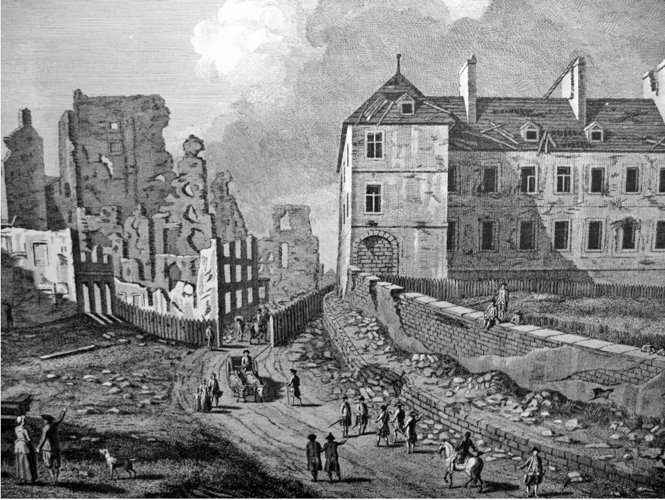
Vue du Palais épiscopal et de ses ruines à Québec (détail). Gravure d'A. Benoist d'après un dessin de Richard Short. Édité par Thomas Jefferys à Londres, 1761.

Depuis 8 heures du soir jusqu'à 6 heures du matin ce jourd'huy, les ennemis nous ont envoyé 230 bombes comptées, ainsy qu'une grande quantité de boulets ; c'est d'usage que quand ils souffrent à la campagne ils se vengent sur la ville 81 .