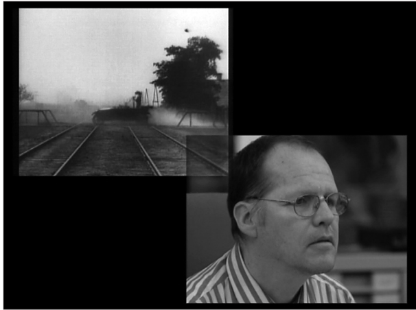
Fig. 2: Harun Farocki, Gegen-Musik/Contre-chant , 2004.

On peut décrire l'opposition entre ces deux types d'images par ce que Jacques Rancière appelle l'image « ostensive », qui se réclame d'une présence pure au nom de l'art et ce qu'il appelle l'image « nue » vouée au seul témoignage. Comme projet de l'art contemporain, selon le diagnostic dialectique de Rancière, au-delà de l'image ostensive et de l'image nue, il ne resterait