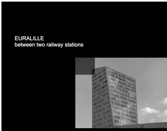
Fig. 1 : Harun Farocki, Gegen-Musik/Contre-chant , 2004.

26. Vertov distingue en fait six étapes du montage : 1 – au moment de l'observation ; 2 – après l'observation (organisation mentale de ce qui a été vu) ; 3 – pendant le tournage (Œil armé) ; 4 – après le tournage ; 5 – le coup d'Œil (« chasse aux morceaux de montage » ; saisir les images de liaison) et 6 – montage définitif. Dziga Vertov, « Instructions provisoires aux cercles du ciné-ciel », dans Articles, journaux, projets , traduction et notes par Sylvianne Mossé et Andrée Robel, Paris, dans Union générale d'éditions, 1972, p. 102.