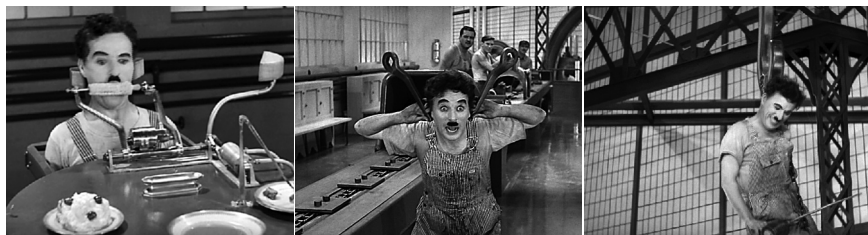
Fig : 2a, 2b, 2c : Charlie Chaplin, Modern Times ( Les temps modernes , 1936), ©MK2.

L'animalisation du travailleur, disséminée en quelques images furtives , récapitule les diverses étapes du sort de la bête d'élevage : son alimentation, sa transhumance en troupeau (ce que l'industrie appelle la « viande sur pattes »), le passage de l'organisme dans la machine et l'apparition dernière du corps suspendu au crochet. Elle traduit certes l'aliénation du travailleur, son devenir-autre, mais en le déclinant à travers une modalité souvent ignorée au profit de la