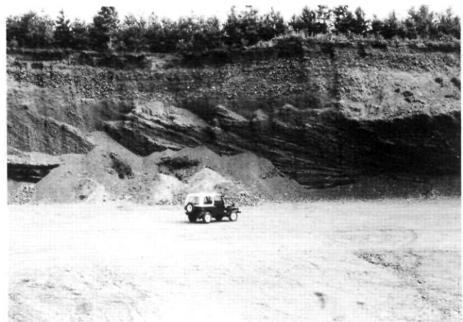
FIGURE 3. Delta juxtaglaciaire de Beebe associé à la phase III et montrant des structures deltaïques complètes.

Une date minimale pour la phase III (UQ 129: 14 860 \pm 160 BP; non corrigée) est obtenue sur une concrétion près de Beebe, dans une importante coupe le long de la rivière Tomifobia (BOISSONNAULT et al. , 1981). Cet échantillon de sable graveleux cimenté par la calcite provient de sédiments fluviolacustres localisés sous une couche de till recouverte par des sédiments prodeltaïques de la phase III. La présence de ces concrétions dans le delta de Stanstead indique que l'ensemble de la coupe est inondé lors de la phase III. En conséquence, cette date fournit l'âge minimal de cette phase et, indirectement, l'âge approximatif du début de la déglaciation dans le sud du Québec. Cette date concorde assez bien avec celle obtenue par GADD et al. (1972) au fond du Unknown Pond, tout près de la frontière Québec-Maine (GSC-1339: 14 900 \pm 200 BP).