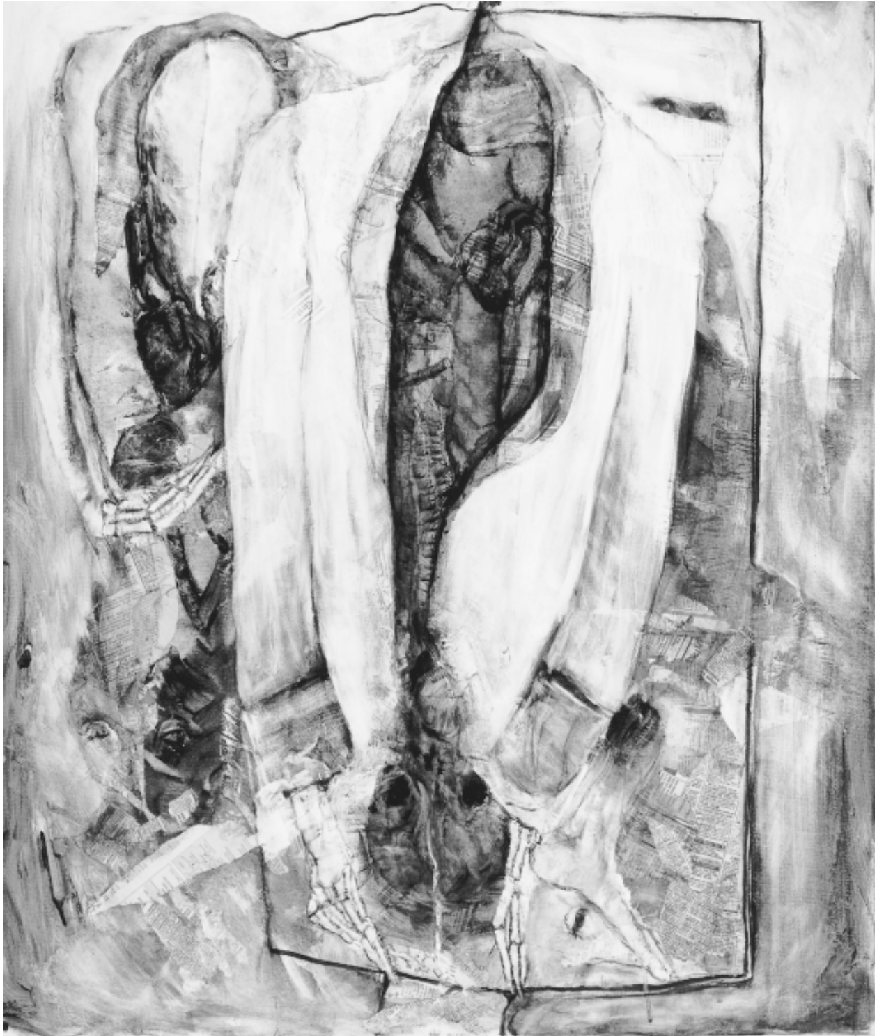
Sans titre, 76 x 91cm, 1991.