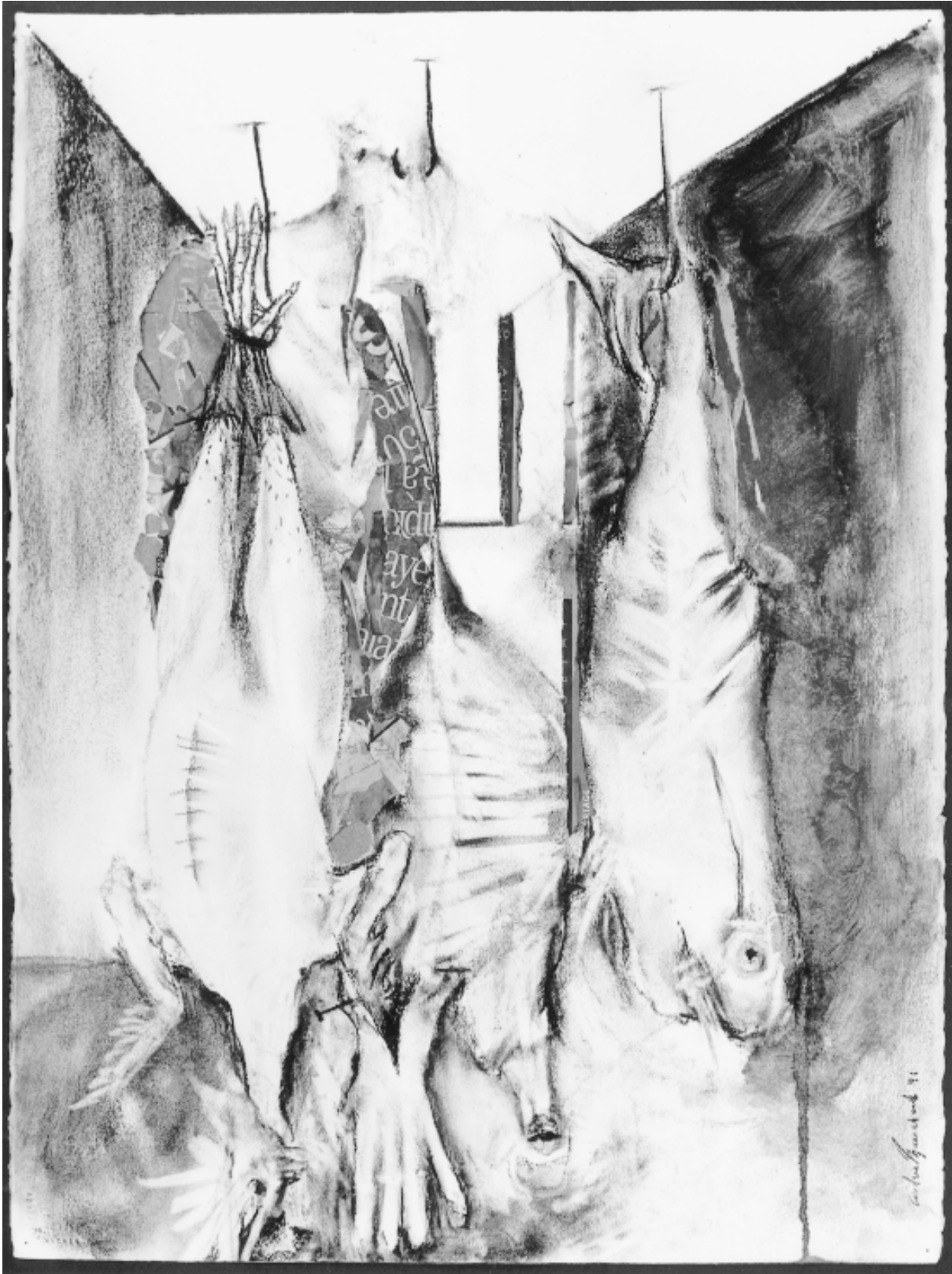
Sans titre, 56 x 76cm, 1991.