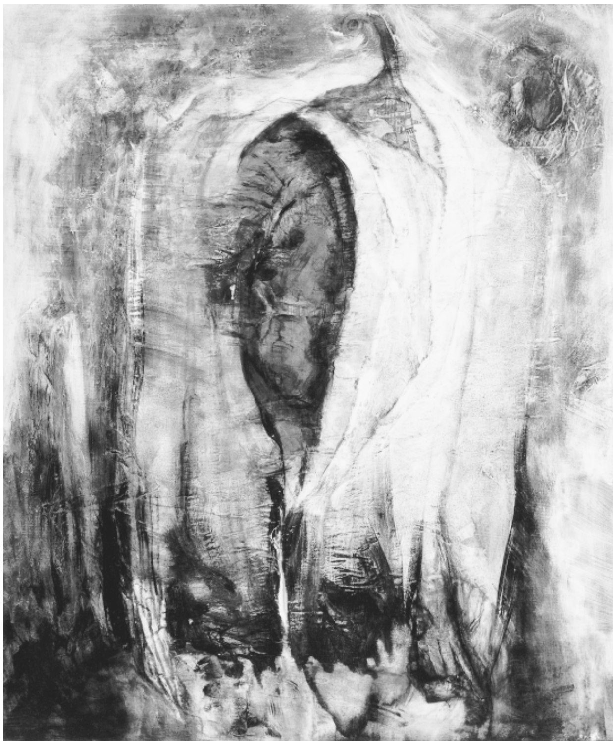
Sans titre, 76 x 91cm, 1991.