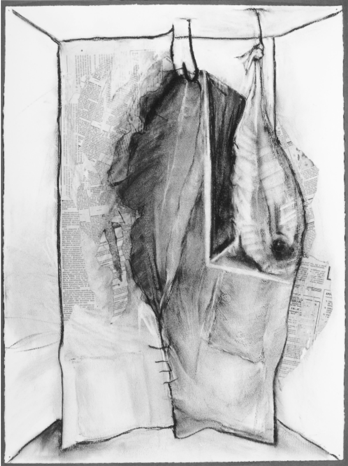
Sans titre, papier-collage, 56 x 76cm, 1991.