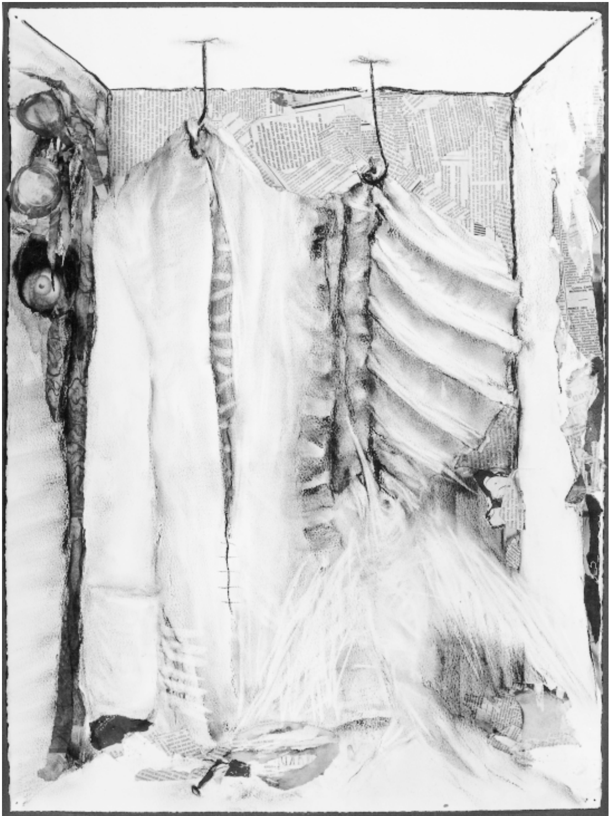
Sans titre, dessin, 56 x 76cm, 1991.