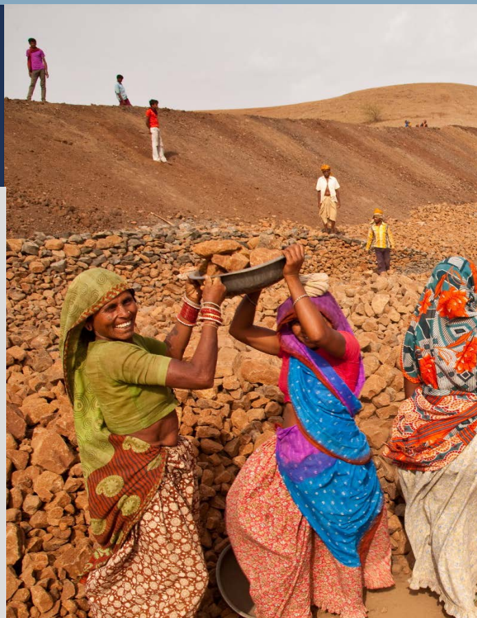
Caption: Women building a pond to assist in farming and water storage in Madhya Pradesh

INITIATIVE ON National Policies and Strategies