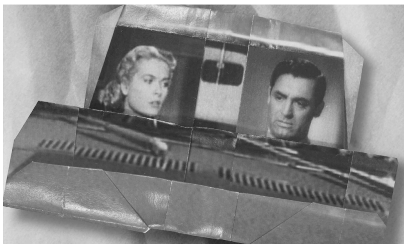
Fast Film , Virgil Widrich (2003)

ombre apparaît, reconnaissable entre mille : Humphrey Bogart. Il pousse une porte, découvre Lauren Bacall, mais il y a un faux raccord. Humphrey n'est plus habillé de la même manière. Il va d'ailleurs continuer à se substituer à lui-même, dans d'autres costumes et à d'autres âges. Lauren également est remplacée soit par elle-même, soit par d'autres actrices. Ils échangent un baiser, la position reste la même, les protagonistes changent. La texture de l'image est curieuse. Il s'agit de papier en fait, qui tremble et se met à se déchirer. Un horrible bruit de train. L'image se plie sur elle-même ; l'héroïne est faite prisonnière et se trouve enfermée dans un sarcophage composé d'images cinématographiques, certaines en couleurs, d'autres non, certaines visiblement contemporaines, d'autres très datées. Les images pliées forment un petit wagon qui s'en va sur un décor de western. Le film joue sur plusieurs dimensions et multiplie les surfaces. Un cheval de papier, calquant les postures de sa course sur les célèbres photographies de Muybridge, prend en charge Bogart. Une chaotique remontée du train en course folle commence. Les adversaires se multiplient, chaque wagon devenant une surface cinématographique pour cow-boys, monstres et autres personnages égarés. Le héros saute dans le train, se transforme en Tarzan, puis en pirate, avant de prendre encore les traits de Harrison Ford dans Indiana Jones . La