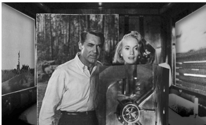
Fast Film , Virgil Widrich (2003)

Le film, d'une rare complexité, se donne donc à voir comme une histoire prise en charge par d'innombrables extraits de films qui existent tous autant comme citations filmiques que comme éléments figuratifs et narratifs structurants. Les niveaux de lecture sont bien entendu multiples, les images ne cessant de se télescoper (nombreux jeux ayant recours à la latéralité mais aussi de profondeur, les strates d'images étant nombreuses 21 ) et de produire entre elles de nouveaux effets de sens.