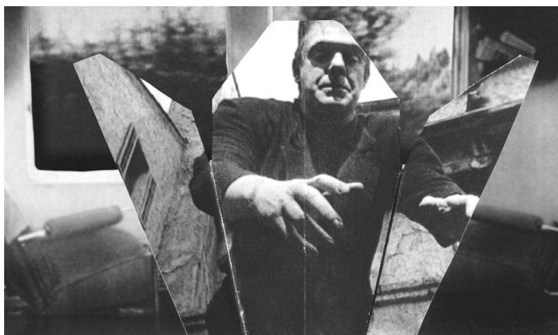
Fast Film , Virgil Widrich (2003)

tion de l'identité y est posée avec force : d'une part à travers le travail d'identification des images exigé en permanence, d'autre part à travers la crise d'identification du spectateur qui ne cesse de chercher sa place (les acteurs ne cessent de se substituer les uns aux autres, créant par là un important effet d'instabilité).