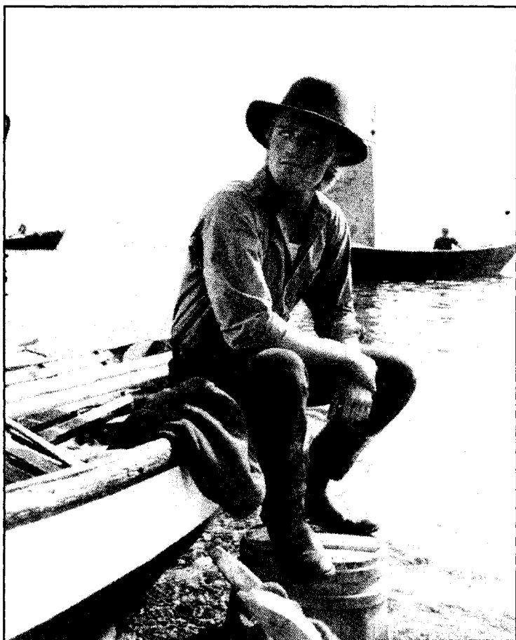
Les Fous de Bassan d'Yves Simoneau (1986)

personnage. C'est d'abord une silhouette, « la ligne générale d'un corps » comme le dit le dictionnaire Larousse. C'est une enveloppe, un contenant, sombre au demeurant et, en ce sens, difficile à décrire avec précision. S'il a de longues jambes, l'ensemble est pourtant dégingandé c'est-à-dire « disloqué dans ses mouvements et dans sa démarche » — toujours le dictionnaire ! Le nimbe du soleil l'entoure comme une auréole. Son chapeau mou cache mal un visage émacié et des yeux pâles. Sa première apparition publique a lieu dans l'embrasure de la porte demeurée ouverte de la petite église de Griffin Creek au moment où tout le village y est