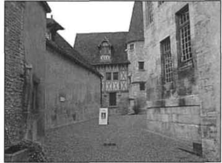
Figure 4 Musée du vin