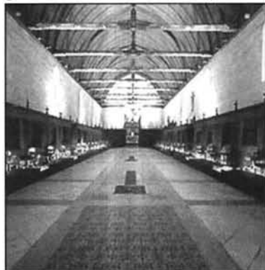
Figure 3 Chambre des pôvres