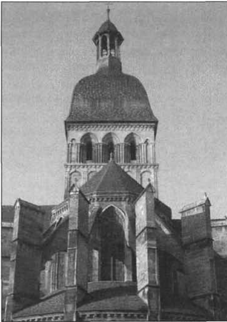
Figure 5 Abside de la Collégiale Notre-Dame

lieux comme la Collégiale Notre-Dame, avec son portail et ses tapisseries, ou l'ancien hôtel des Ducs de Bourgogne qui abrite aujourd'hui le Musée du Vin (figure 4) ne semblent pas avoir été choisis pour mieux représenter la tessiture du lieu et ses différentes composantes, mais bien plutôt pour décliner une même typicité, apparemment jugée seule essentielle et apte à atteindre les objectifs promotionnels souhaités. À la toute-puissance de l'Hôtel-Dieu correspond donc celle, à peine plus mitigée et moins impérative, des quelques bâtiments et places