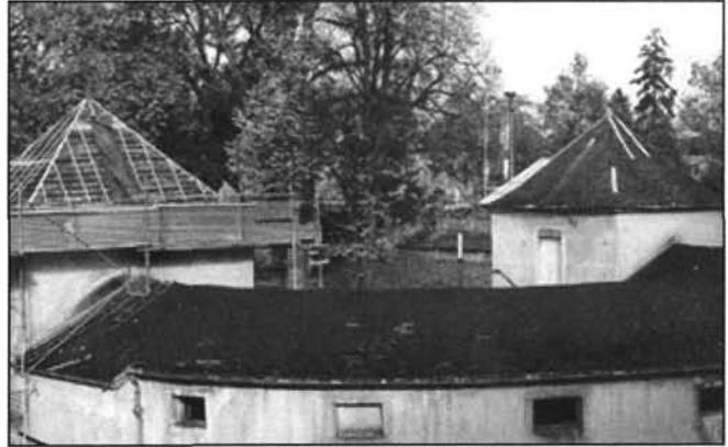
Figure 7 Bains-douches du théâtre de verdure