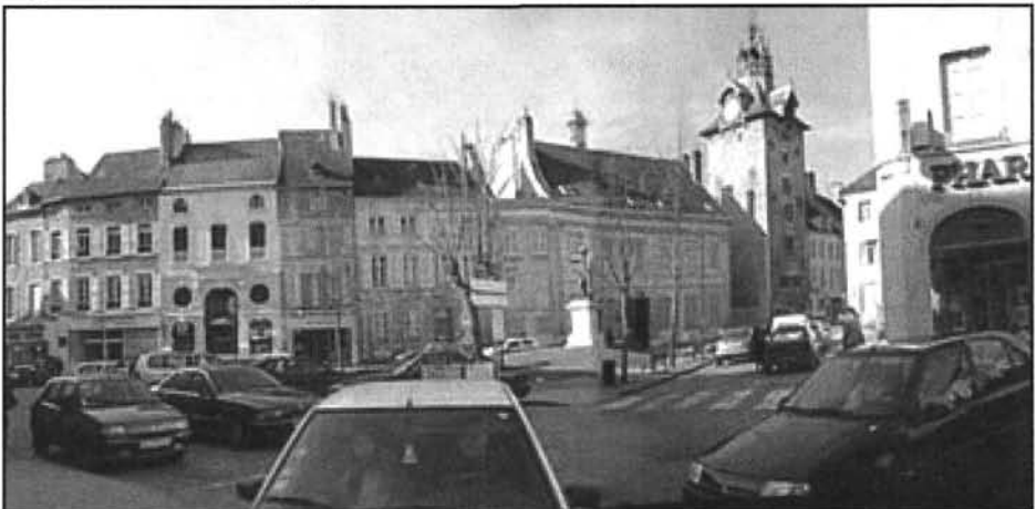
Figure 8 Place Monge et son beffroi

fait l'histoire, mais qui l'ont investie (Larrère, 1995)? Des ornements architecturaux qui rehaussent les portes, porches et façades d'hôtels particuliers moins célèbres, voire de simples résidences? Des arrières-cours, rues et places