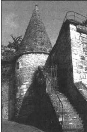
Figure 6 Remparts de Beaune

Ce qui n'est pas rien, sauf que... le musée des Beaux-Arts, le beffroi de Monge, l'hôtel de la Rochepot, l'église Saint-Nicolas, les vieilles demeures de la rue de Lorraine, les bains-douches du théâtre de verdure ou même ses remparts et bastions, sont-ils moins caractéristiques de Beaune, moins significatifs pour les Beaunois (figures 6, 7 et 8)? Et qu'en est-il de ces autres petits détails qui n'ont peut-être pas