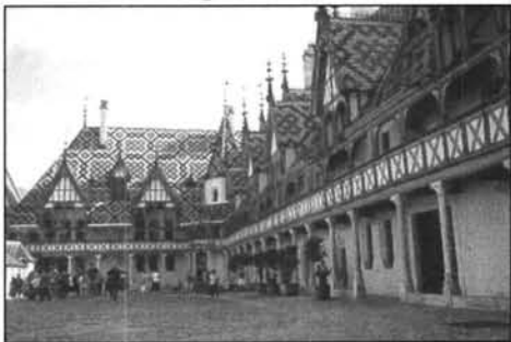
Figure 2 Cour d'honneur des hospices de Beaune

Avant de répondre à ces questions, nous constatons également que la mise en image de Beaune s'appuie à peu près exclusivement sur la cour d'honneur de l'Hôtel-Dieu des Hospices (figure 2), cour présentée sous divers angles et éclairages selon les prises de vue, et renvoyant au mieux à la salle des pôvres (figure 3)