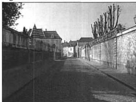
Figure 9 Rue du Château