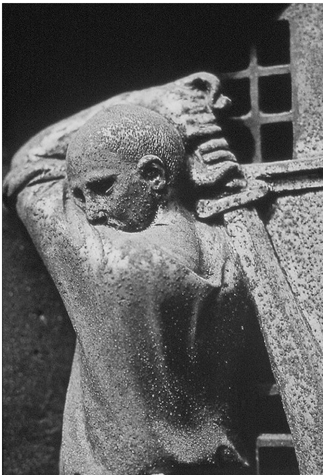
Andrea PISANO, La Décapitation de saint-Jean-Baptiste , 1330-1336, Bronze doré, porte Sud, Baptistère de Florence.