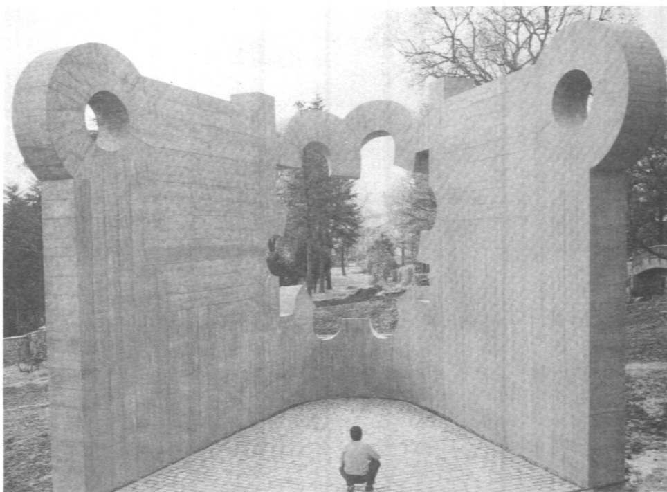
Gure Aitaren Etxea (Eduardo Chillida)

doit être convenablement signifié au moyen de « monuments » dont la valeur symbolique doit être culturellement construite et politiquement légitimée.