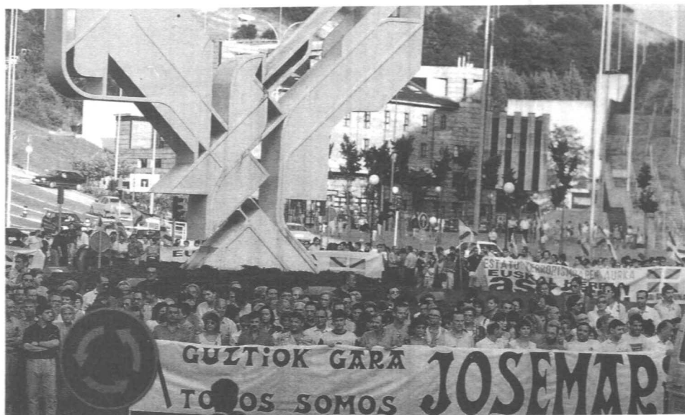
Manifestants autour de la Paloma de la Paz ( El Diario Vasco , 11 août 1995)