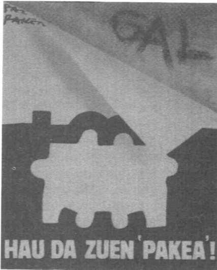
Affiche du GAL

Aux prises avec de nouveaux problèmes politiques auxquels ils doivent faire