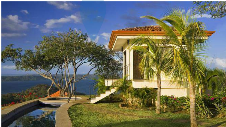
Gambar 2.7 Contoh Time Share

Resort yang berbeda pada sistem sewa kamarnya, di mana ketika pengunjung ingin menyewa kamar maka harus melakukan kontrak yang sudah dicanangkan dalam kurun waktu tertentu, kontrak berisi perjanjian waktu penggunaan kamar, fasilitas yang diinginkan beserta pelayanan khususnya ( Gambar 2.7 ).