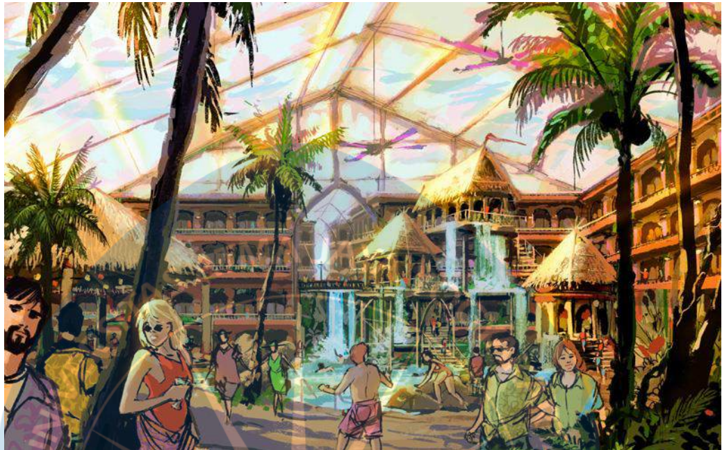
Gambar 2.6 Ilustrasi Themed Resort

Resort ini didesain dengan tema dan ciri khas tertentu yang dijadikan daya tarik utama ( Gambar 2.6 ).