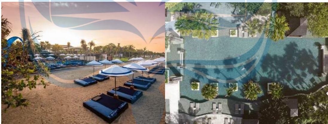
Gambar 2.16 Lanskap Sofitel Bali Nusa Dua Beach Resort