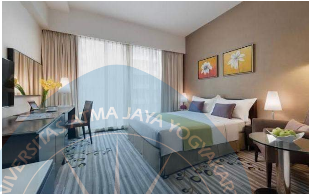
Gambar 2.11 Contoh Superior Room

Superior room adalah tipe kamar yang cukup mewah dengan dilengkapi satu double bed yang digunakan untuk dua orang tamu ( Gambar 2.11 ).