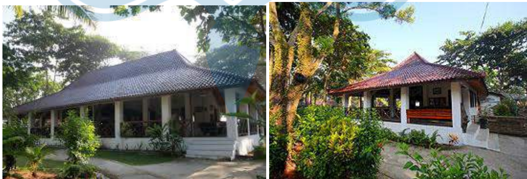
Gambar 2.19 Fasade Restoran dan pondok dari Ombak Indah Resort

Lansekapnya memiliki konsep tropis dengan penataan taman yang menggunakan vegetasi khas kawasan pantai. Terdapat juga kolam renang yang memiliki pemandangan langsung ke pantai ( Gambar 2.20 ).