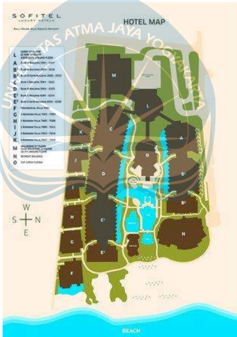
Gambar 2.14 Site Plan Sofitel Bali Nusa Dua Bali Beach Resort