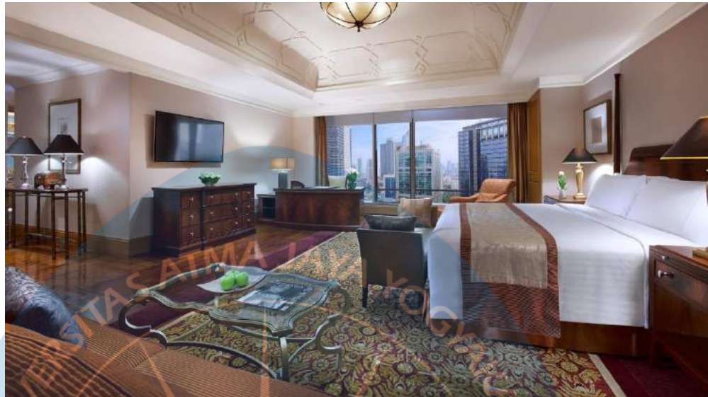
Gambar 2.13 Contoh President Suite Room

President suite room adalah tipe kamar yang berfasilitas lengkap dan memiliki harga yang cukup mahal ( Gambar 2.13 ).