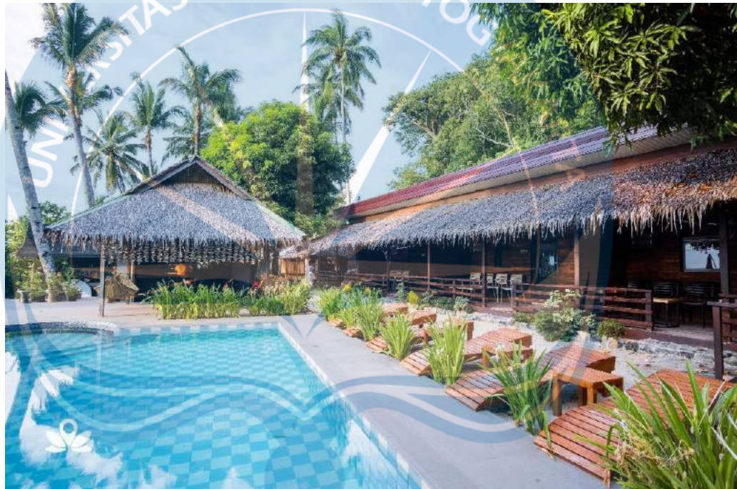
Gambar 2.1 Contoh Beach Resort

Resort yang terletak pada kawasan pantai. Nilai jual yang ditawarkan adalah view pantai yang dapat dinikmati oleh wisatawan nusantara maupun mancanegara. Selain itu, dapat juga diberikan olahraga air seperti banana boat , selancar, dan snorkeling ( Gambar 2.1 ).