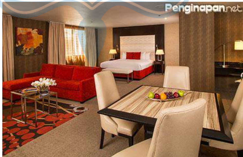
Gambar 2.12 Contoh Suite Room

Suite room adalah tipe kamar mewah yang dilengkapi beberapa kamar tamu, ruang makan, dapur kecil, dan kamar tidur dengan sebuah king bed ( Gambar 2.12 ).