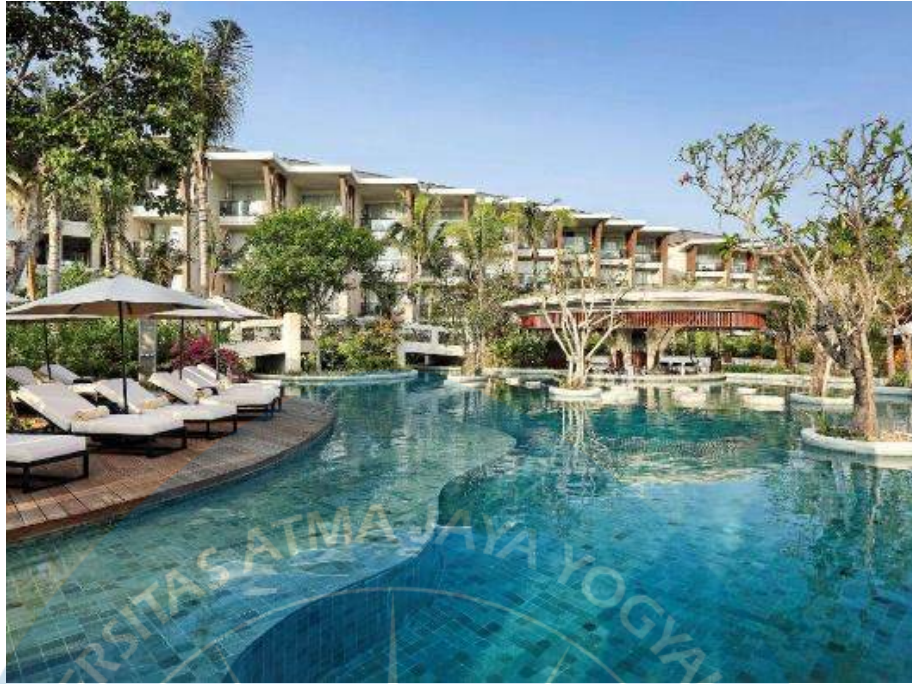
Gambar 2.15 Fasade Sofitel Bali Nusa Dua Bali Beach Resort