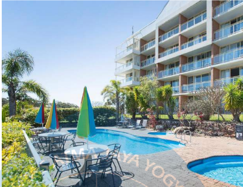
Gambar 2.2 Contoh Marina Resort