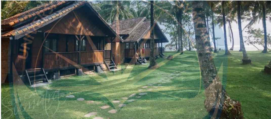
Gambar 2.17 Fasade salah satu pondok dari Sumatra Surf Resort

Penataan ruang luar resort ini mengambil view ke pantai sebagai point utamanya, sehingga para pengunjung dapat menikmati pemandangan pantai dengan lega. Tamannya sendiri berkonsep taman tropis, dengan penggunaan vegetasi tropis dipadukan dengan kolam renang di tengah area resort yang langsung menghadap pantai ( Gambar 2.18 ).