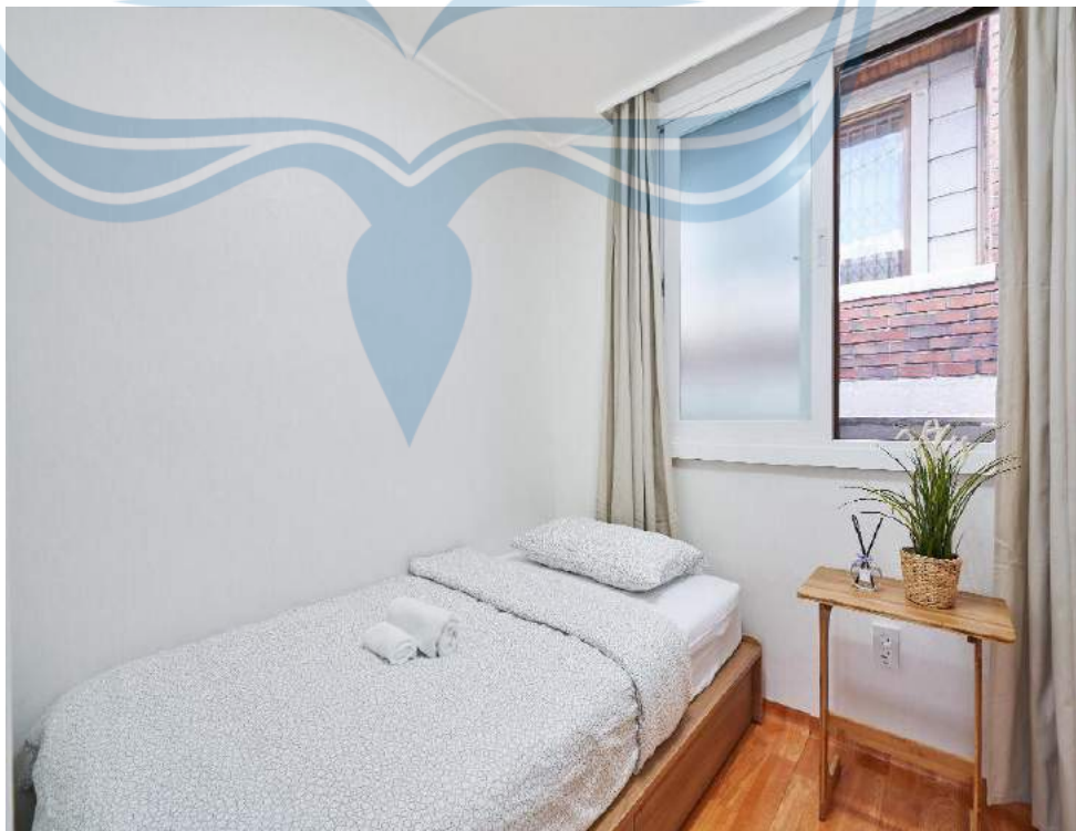
Gambar 2.8 Contoh Single Room

Single room adalah tipe kamar yang memiliki standar ekonomi dengan dilengkapi satu tempat tidur untuk satu orang tamu ( Gambar 2.8 ).