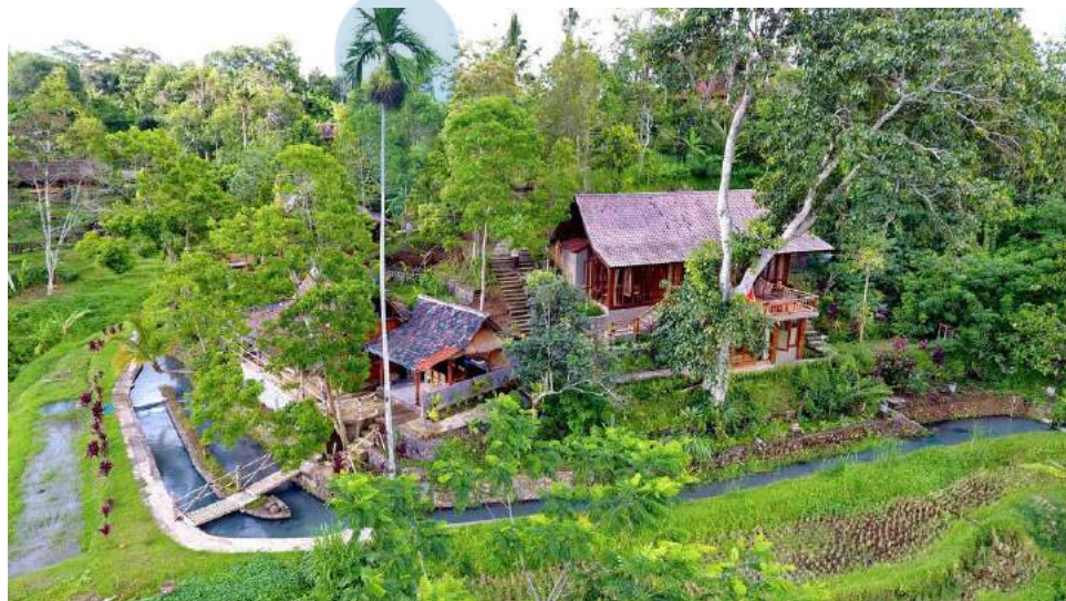
Gambar 2.5 Contoh Rural Resort and Country Resort

Resort jenis ini terletak pada lokasi yang jauh dari pusat kota. Nilai jual dari resort ini adalah lokasinya yang berada di desa dan memiliki fasilitas rekreasi yang bersifat kawasan dengan skala yang luas seperti lapangan golf , jogging track , panjat tebing, dan kegiatan khusus lainnya ( Gambar 2.5 ).