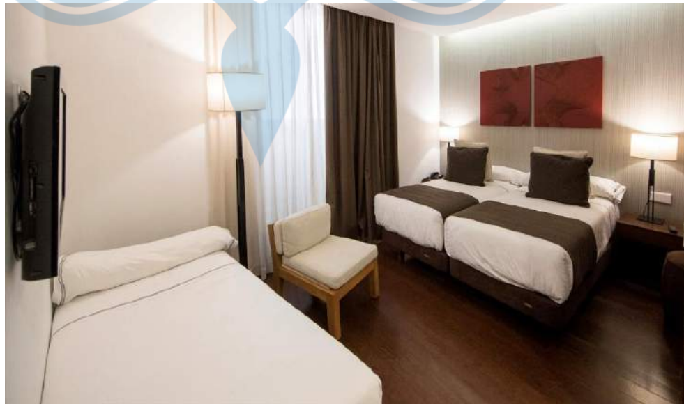
Gambar 2.10 Contoh Triple Room

Triple room adalah tipe kamar yang memiliki standar ekonomi dengan dilengkapi dua tempat tidur atau satu tempat tidur double dengan satu tempat tidur tambahan untuk tiga orang tamu ( Gambar 2.10 ).