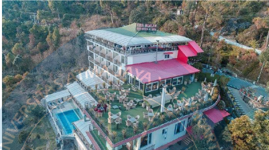
Gambar 2.4 Contoh Health Resort and Spa

Resort jenis ini berlokasi di kawasan dengan potensi alam yang dapat dimanfaatkan sebagai media pengobatan dan penyehatan psikologis bagi pengunjungnya. Fokus dari resort jenis ini adalah pada pelayanan dan fasilitas pengobatan sebagai nilai jualnya ( Gambar 2.4 ).