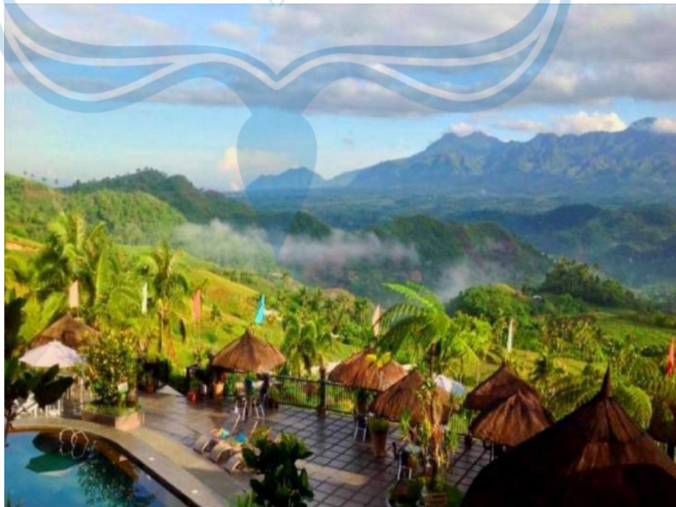
Gambar 2.3 Contoh Mountain Resort

Resort yang terletak di daerah perbukitan maupun pegunungan. Potensi yang diandalkan dengan membangun resort di daerah ini adalah dapat memperlihatkan keindahan alam pegunungan yang asri. Nilai jual lain dari resort jenis ini adalah suasana yang lebih sejuk dibandingkan resort lainnya ( Gambar 2.3 ).