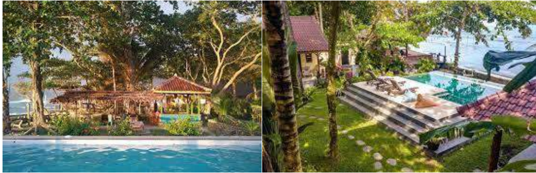
Gambar 2.20 Lanskap dari Ombak Indah Resort