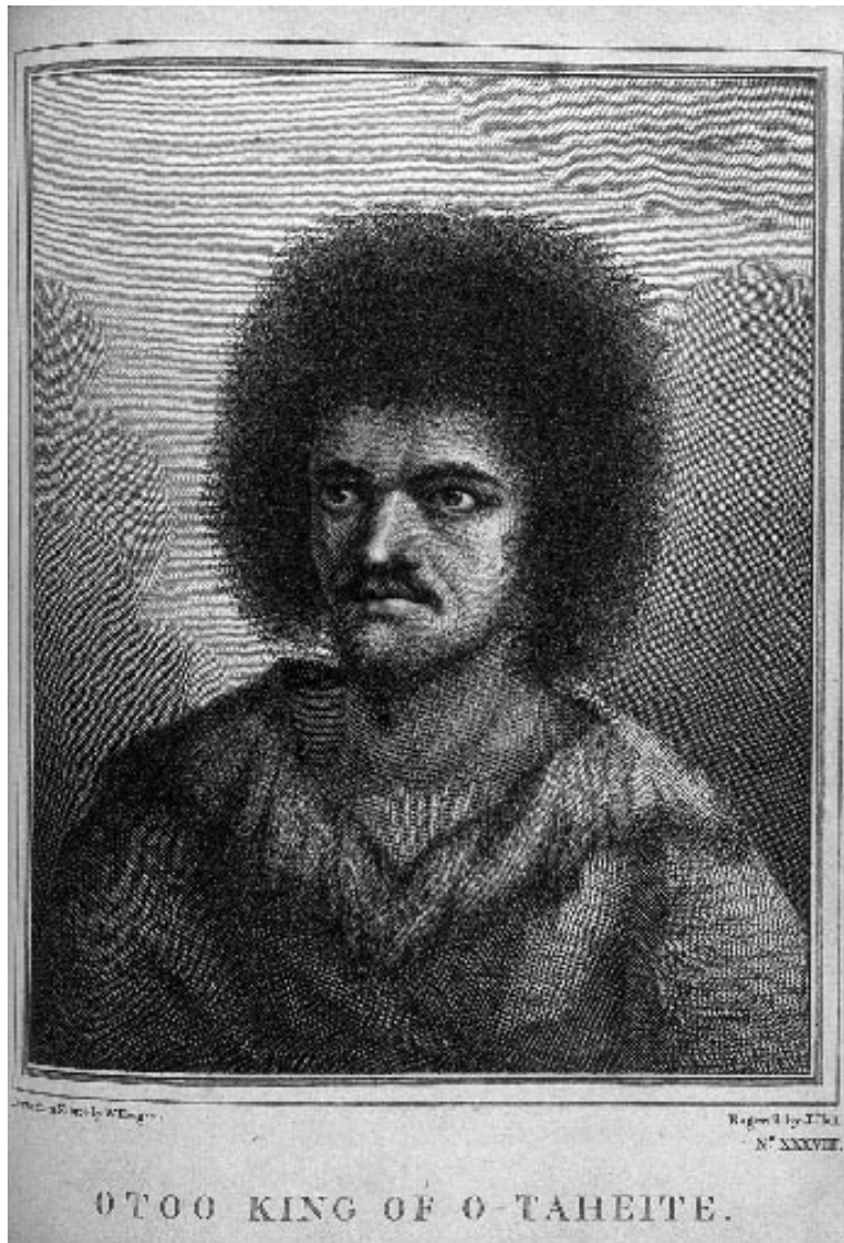
Figure 3. « Otoo King of O-Tahite ». Gravure au burin et à l'eau-forte de John Hall d'après un dessin de William Hodges, dans James Cook, A Voyage Towards the South Pole, and Around the World. Performed in His Majesty's Ships the Resolution and Adventure, in the Years 1772, 1773, 1774, and 1775. Written by James Cook, Commander of the Resolution. In which is included, Captain Furneaux's Narrative of his Proceedings in the Adventure During the Separation of the Ships. Illustrated with Maps and Charts, and a Variety of Portraits and Views Drawn during the Voyage by Mr. Hodges , Londres, Strahan & Cadell, 1777, vol. I, planche XXXVIII (en regard de la p. 154), 28,6 x 22 cm (page), Yale Center for British Art, Paul Mellon Collection.