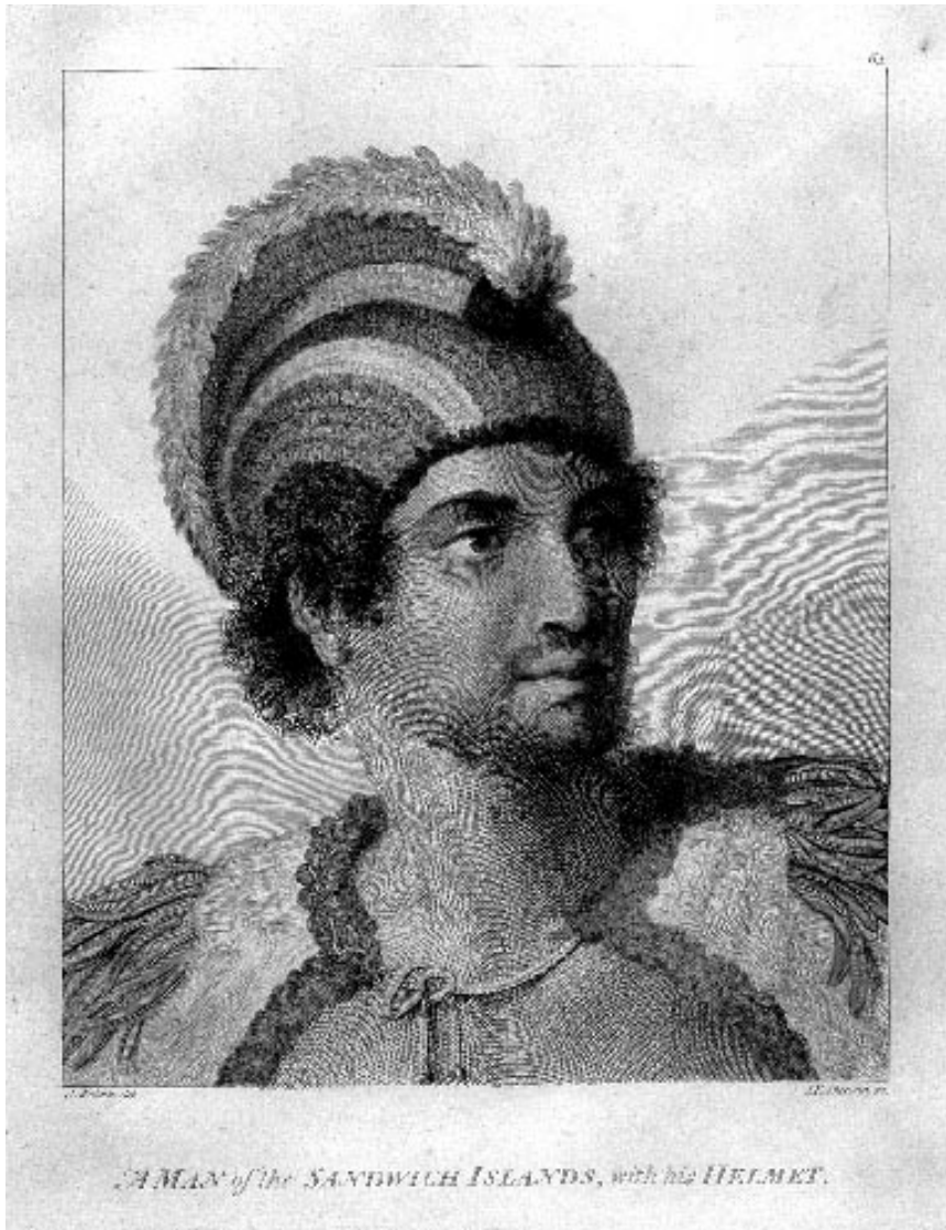
Figure 5. « A Man of the Sandwich Islands, with His Helmet ». Gravure au burin et à l'eau-forte de John Keyse Sherwin d'après un dessin de John Webber, dans James Cook et James King, A Voyage to the Pacific Ocean. Undertaken, by the Command of His Majesty, for Making Discoveries in the Northern Hemisphere, to Determine the Position and Extent of the West Side of North America ; Its Distance From Asia ; and the Practicability of a Northern Passage to Europe. Performed Under the Direction of Captains Cook, Clerke, and Gore, in His Majesty's Ships the Resolution and Discovery, in the Years 1776, 1777, 1778, 1779, and 1780 , Londres, Strahan Nicoll & Cadell, 1784, planche LXIV (placée en regard de la p. 126 du vol. III, ou incluse dans un 4 e vol. de planches), 28,9 x 22,8 cm (coup de planche), Yale Center for British Art, Paul Mellon Collection.