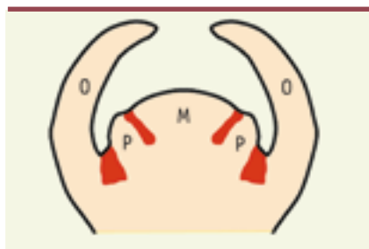
Figure 1. Méristème et domaines frontières. Le méristème (M) produit des primordia (P) sur ses flancs qui se développeront en organes (O), telles les feuilles. Un domaine frontière ici en rouge sépare les primordia entre eux et du méristème.

> Chez les plantes, tous les organes latéraux de la partie aérienne, qu'il s'agisse de feuilles ou de pièces florales comme les pétales ou les étamines, sont issus des méristèmes. Ces structures en prolifération contiennent les cellules souches de la plante et sont le siège d'une organogénèse continue. Au sein des méristèmes, suivant un minutage et à une position finement contrôlés, un groupe de cellules va s'individualiser, bourgeonner en un primordium et donner naissance à un organe (Figure 1). Les primordia d'organes sont séparés entre eux et du méristème par un domaine frontière formé par un ruban de cellules. Les cellules appartenant à ces domaines sont reconnaissables par les gènes qu'elles expriment. Ainsi, chez la plante modèle Arabidopsis thaliana , les cellules des domaines frontières expriment les gènes CUC1 , 2 et 3 [1-3]. Ces marqueurs moléculaires des domaines frontières en sont