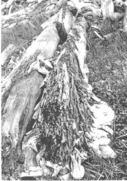
Figure 4. Bois en cours de décomposition, ligne de tempête 1974, baie de Norton.