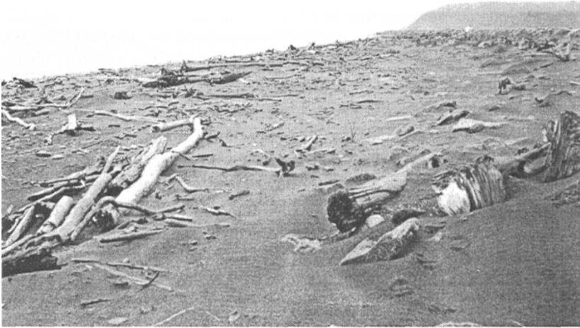
Figure 2. Bois flotté dans la baie de Norton à l'est de Nome.