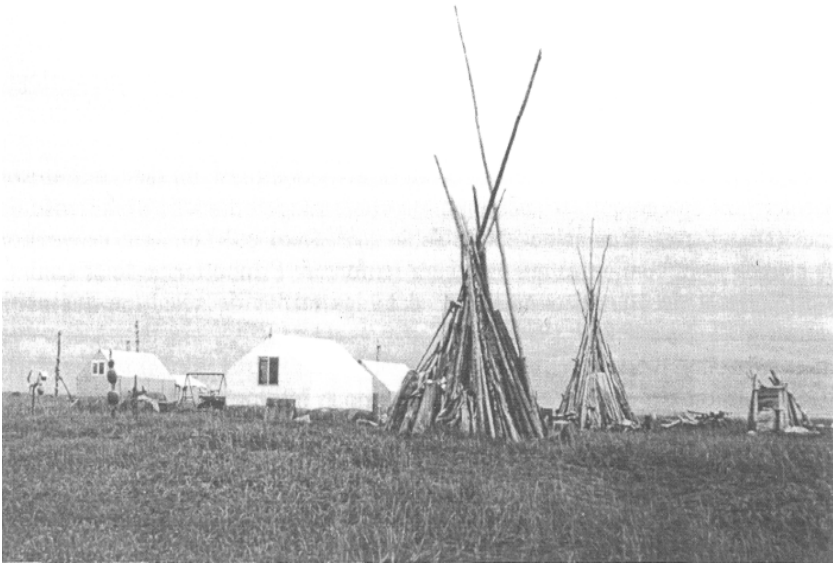
Figure 5. «Tipis» de bois flottés (grumes mises à sécher pour un usage ultérieur), baie de Norton, à l'est de Nome.