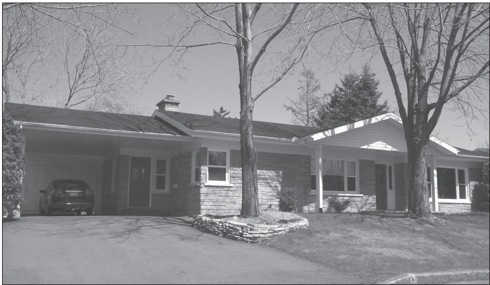
Figure 10 Le carport du bungalow : simple prolongement du toit et facilement « ajoutable », celui-ci a été partiellement « fermé » pour, comme dans de nombreux cas, devenir une pièce supplémentaire de la maison. Sillery (Québec)

Redevance du « bungalow à long pan » à l'automobile qui rendait possible, à l'échelle urbaine, son terrain oblong, l'abri d'auto, mieux connu au Québec sous le nom de carport et considéré à ses débuts comme une variante économique du garage 18 , devint dans les années 1960 le compagnon presque forcé du bungalow 19 (figure 10). Certes, la SCHL, déjà en 1960, constatait déjà que « The automobile and its requirements tend more and more to dominate the design » (CMHC, 1958 : III-1). Au Québec cependant, sans doute sous l'effet conjugué du climat et de la primauté de la cuisine du bungalow, l'abri d'auto, au fil des hivers, reporta sur la façade latérale l'entrée principale de la maison, allant jusqu'à condamner l'entrée de façade principale. Celle-ci, dont on avait souvent supprimé le hall 20 afin d'élargir un salon réduit à sa plus simple expression par l'expansion de la cuisine-salle de famille 21 ,