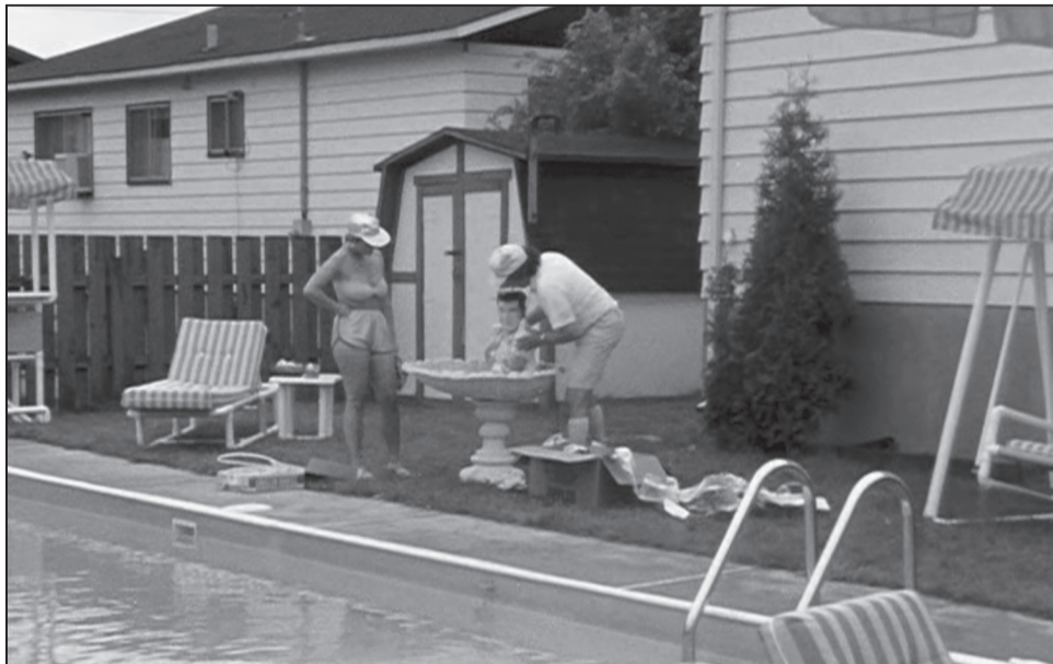
Figure 6 La représentation de l'appropriation de la cour arrière du bungalow, de sa piscine, de ses ornements et de son cabanon, livrée par le film Elvis Gratton