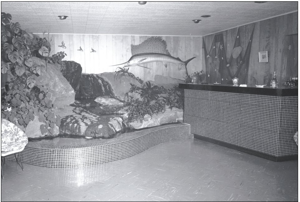
Figure 12 Un sous-sol aménagé en salle de divertissement et bar à Québec

Chambre ou musée, discothèque ou salle de jeux, le sous-sol s'avéra ainsi, au fil du temps, l'un des espaces privilégiés du bungalow québécois – qu'il finit d'ailleurs par surhausser, puisqu'on fenêtra le soubassement pour l'éclairer (figure 12). La réforme du système québécois de l'éducation entreprise au milieu des années 1960 à la suite du « rapport Parent » ( Rapport de la Commission royale d'enquête sur l'enseignement de la province de Québec , 1964) en remplaçant les pensionnats par les