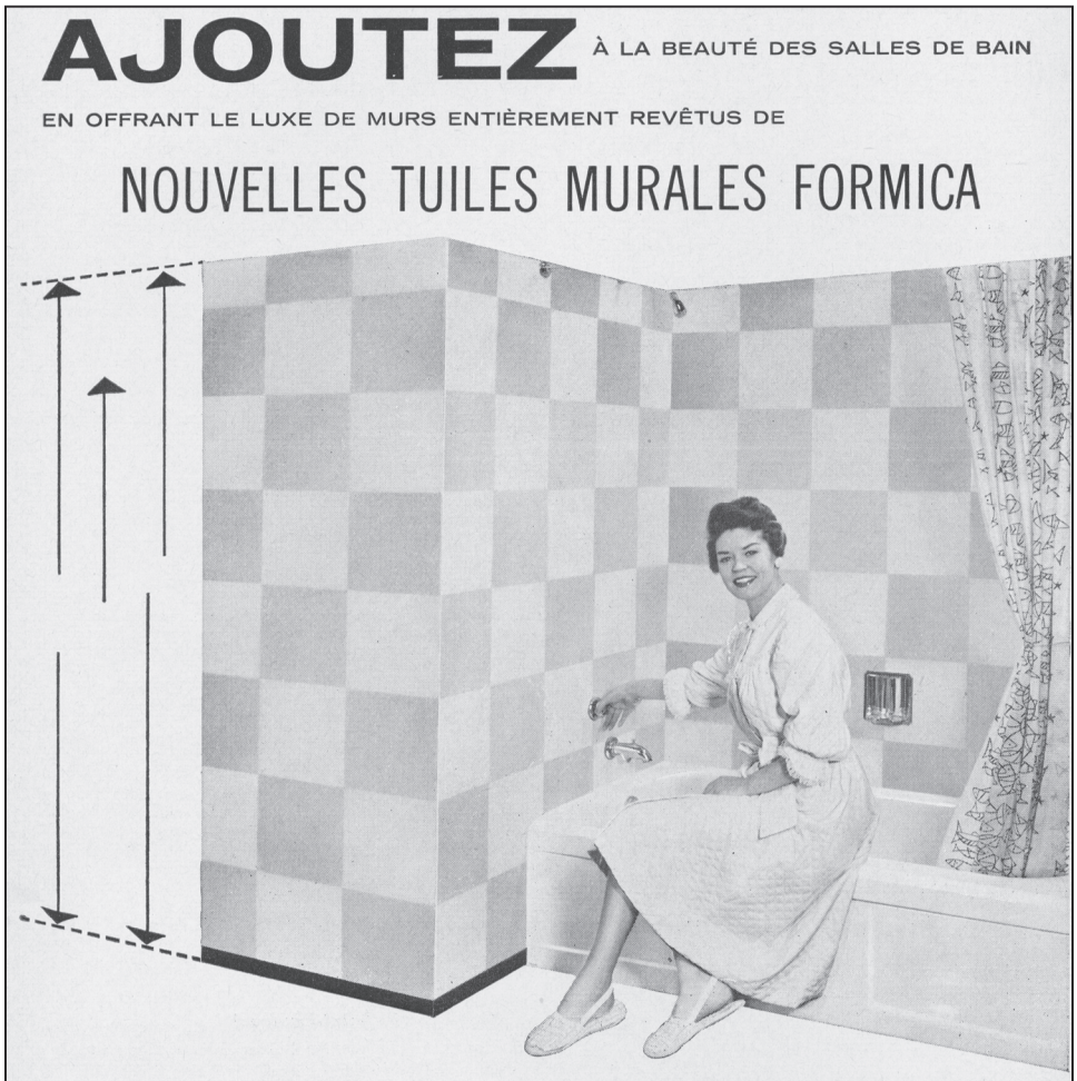
Figure 8 La « révolution des salles de bain » et les nouveaux matériaux