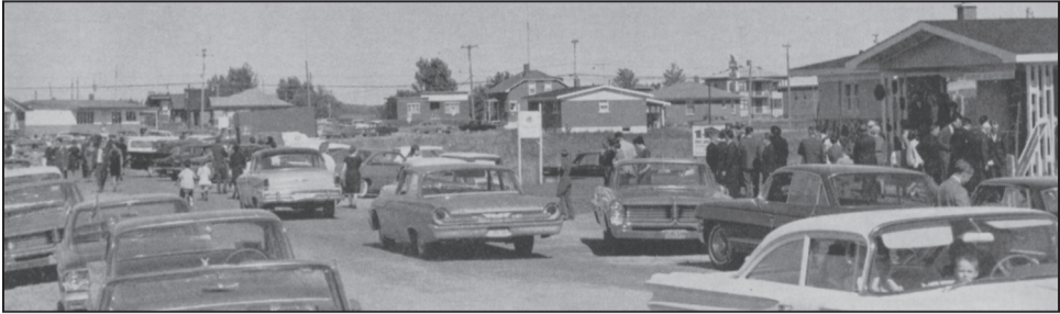
Figure 3 La « parade » des Bois-Francis, 1964

Source : Bâtiment , novembre 1964, p. 34.