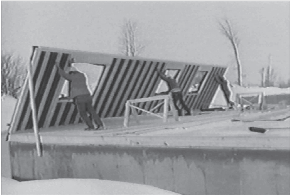
Figure 2 Représentation quasi caricaturale de la facilité de construction: « l'assemblage » d'un bungalow