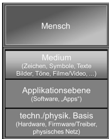
Abbildung 1: Interaktionsmodell Mensch-Medium-Maschine

Mediale und technische Dimensionen digitaler Medien pädagogisch begleitet sichtbar zu machen, gelingt vor allem durch handlungsorientierte Zugänge, wie sie die Aktive Medienarbeit bietet: Dabei werden die gestalterischen Möglichkeiten der Medienproduktion durch eigenes kreatives Gestalten erfahren. Digitale Medien werden dabei zu Bildungsinhalten , wenn Handelnde über das Greifen und Manipulieren ( manus plere im eigentlichen Wortsinn), das auch körperliche und emotionale Aspekte beinhaltet (vgl. u. a. Knaus 2023, S. 4 f.), etwas über diese be -greifen. Insofern verstehen wir den Begriff der Reflexion in pragmatistischer Perspektive als Amalgam von Handeln und Denken und damit die Reflexion über mediale Handlungsmöglichkeiten als ein im aktiven medialen Gestalten fundiertes Nachdenken über (Medien-)Inhalte und Systeme. Die jeweilige Bedeutung dieser