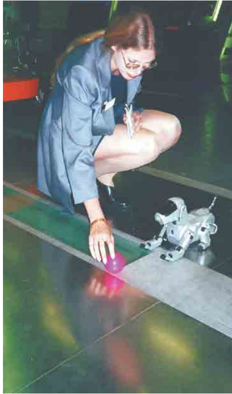
На выставке в Музее науки в Лондоне, 2000 г. Одна из первых моделей собачки-робота Aibo вызвала живой интерес посетителей.

«Эти результаты могут пригодиться при разработке...». Если люди испытывают эмпатическое смущение по отношению к роботам, это говорит о том, что люди предполагают, что роботы могут осознавать, что за ними наблюдают, и обладать более высокими когнитивными способностями, такими как саморефлексия и самооценка, – подтверждают японские роботопсихологи. – Таким образом, изучение эмпатического смущения