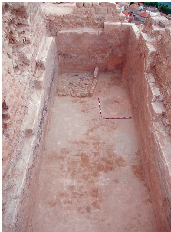
Fig. 3. Vista de la cisterna documentada al peu del mur oriental de la torre.

d'un dipòsit o cisterna. També es va poder comprovar com, per davant d'aquesta capa es localitzava un segon mur de 25 cm d'amplada i fet a base de carreus rectangulars de pedra disposats en filades. Aquesta paret, que revestia la totalitat de l'interior de la cisterna i que estava adossada a l'arrebossat antic, era recoberta també per una capa de morter de calç blanca que servia per millorar la impermeabilització interior. Un cop descomptat el gruix d'aquest mur de revestiment interior, les dimensions de la cisterna eren 6,8 x 2,85 m. Finalment es va localitzar el paviment de l'estructura, a base de rajoles de ceràmica de 32 x 16 cm posades en filades i col·locades a trencajunt. A tocar del mur de tancament oriental es va localitzar una cubeta circular, d'uns 90 cm de diàmetre, el fons de la qual arribava a estar uns 15 cm per sota del nivell de la resta del paviment.