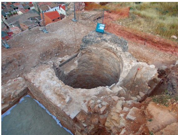
Fig. 6. Vista general del cup