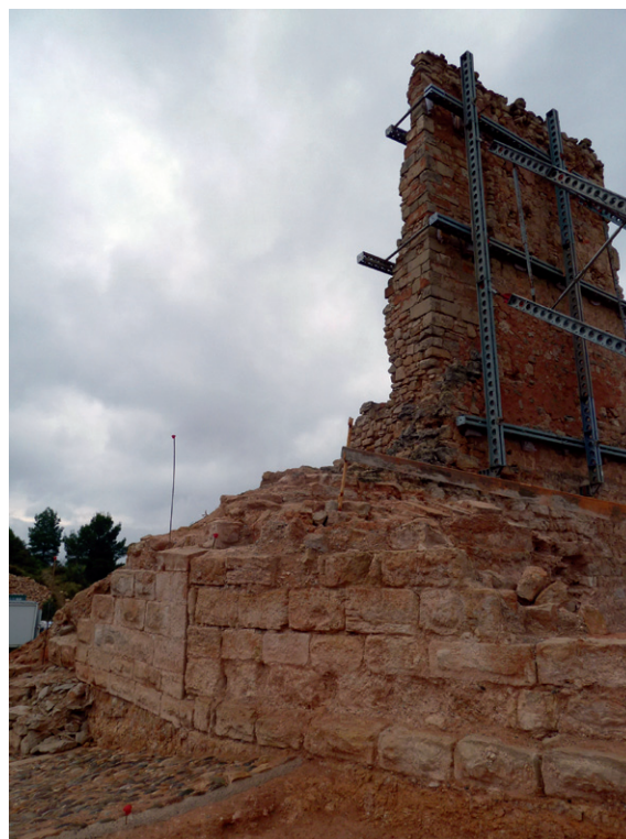
Fig. 5. Detall d'alguns dels murs de tancament del recinte superior del castell per la banda sud.

En el moment d'iniciar-se la intervenció, en el vessant nord del turó, al costat de la torre i de la cisterna, afloraven alguns murs, força destruïts, però que ja demostraven l'existència d'estructures d'interès arqueològic en aquest sector del castell. Aquí l'estratigrafia s'iniciava amb un estrat d'enderroc l'extracció del qual va permetre localitzar un mur perpendicular a la paret de la cisterna. Es tracta d'una estructura de 60 cm d'amplada feta amb pedres lleugerament escairades i col·locades a trencajunt, disposades en filades força regulars i lligades