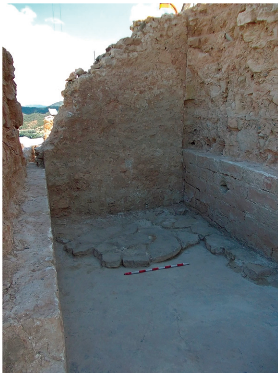
Fig. 9. Vista del dipòsit o cisterna situat al peu de la paret nord de la torre.

ven l'espai i que es va poder definir com una estructura de 3 m d'amplada i una llargada originalment de 5,4 m.