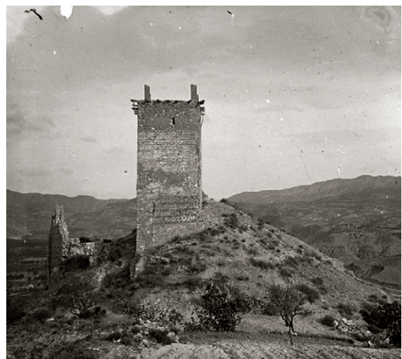
Fig. 2. Fotografia antiga de la torre amb anterioritat a l'ensulsiada de la seva paret occidental.

Amb la conquesta cristiana, la transferència del castell d'Ascó als Templers i la seva transformació en seu d'una Comanda, tant el castell com l'albacar van passar a formar part de les propietats gestionades directament pels Templers, la seva reserva senyorial, de manera que l'antic albacar esdevé el que la documentació posterior anomena Costa del castell i que separa la fortificació de la vila.