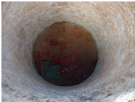
Fig. 7. Vista de l'interior del cup i del seu paviment de peces ceràmiques