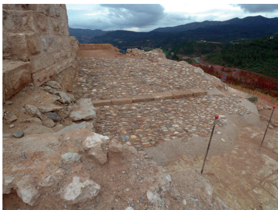
Fig. 4. Vista del camí empedrat d'accés al recinte superior del castell.

que cobria la major part dels edificis antics de la fortificació. La seva eliminació va permetre identificar una sèrie d'estructures que se situaven a un nivell inferior respecte a la torre. Així, es va definir una alineació amb direcció est-oest formada per dos murs successius. El primer correspon a un mur fet amb un full de carreus rectangulars de pedra disposats a trencajunt en filades regulars la inferior de les quals està feta amb carreus encoixinats. El segon presenta un parament semblant però aixecat exclusivament amb carreus encoixinats. A la banda occidental, al peu d'aquests murs es va localitzar un nivell de còdols de riu disposat en un suau pendent en direcció est que sembla que pavimentaria un camí d'accés a la part alta del castell.