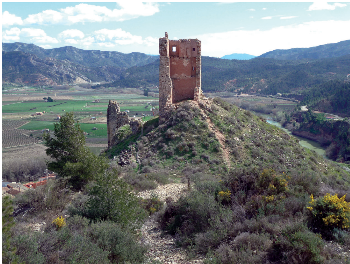
Fig. 1. Vista general del turó del castell, amb la torre, abans d'iniciar-se les intervencions arqueològiques.

En el moment actual estem a l'espera de poder iniciar una nova campanya d'intervencions arqueològiques que permeti completar l'excavació de bona part del recinte principal del castell. Per aquest motiu, els resultats que presentarem a continuació s'han de considerar molt provisionals.