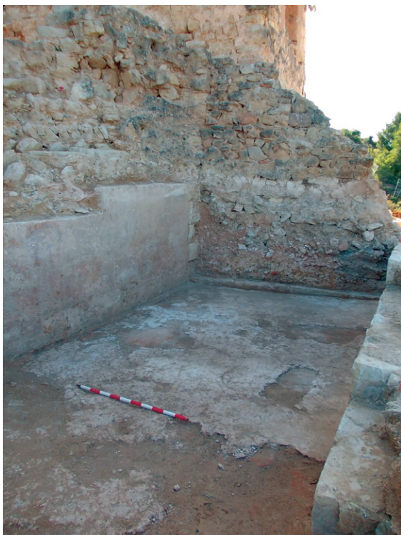
Fig. 8. Vista del dipòsit o cisterna situat al costat del cup, a la banda nord del castell.