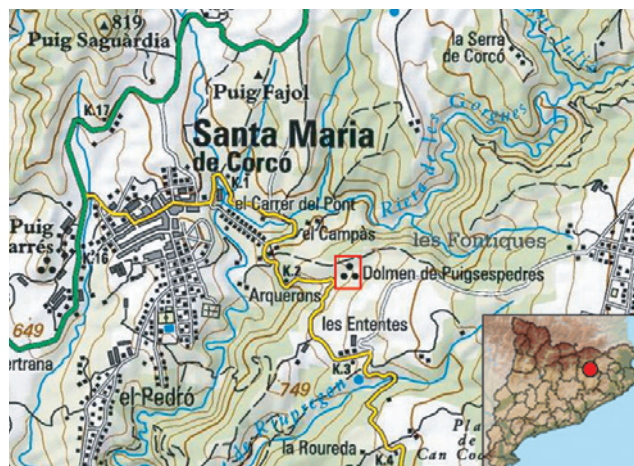
Figura 1. Localització topogràfica del jaciment. (Mapa topogràfic 1:50.000 – ICC - UTM 31N / ED50). Les seves coordenades UTM són: E 448875.8, N 4653832.6 (ED50 UTM 31N) / 723 m.s.n.m.