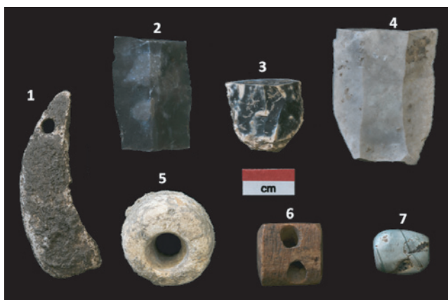
Figura 5. Material arqueològic de l'aixovar funerari. 1: Penjoll de pecten amb perforació distal; 2-4: fragments de làmines de sílex; 5: Penjoll circular de calcària amb perforació central; 6: Botó d'os prismàtic amb simple perforació en V; 7: Dena de variscita amb perforació central.

Pel que fa al material paleoantropològic, cal destacar que és la categoria predominant, representant més del 85 % dels coordinats. Actualment, està en curs un estudi preliminar de les restes paleoantropològiques. En general, els elements més abundants són les dents; la resta són fragments d'ossos alguns determinables, però, en general, de reduïdes dimensions i en mal estat de conservació. Una visió preliminar del material ens assenyalava la presència de restes que es poden relacionar tant amb individus adults com joves i nens, cosa que assenyalava la diversitat mortuòria del megalític.