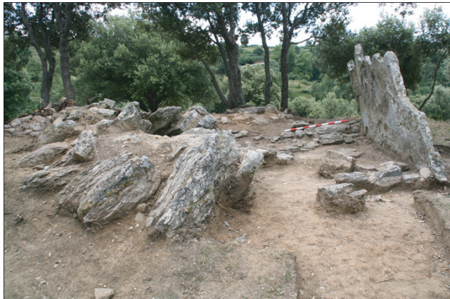
Figura 3. Vista general de Puig Sespedres. S'observa, a la part central, la cambra funerària. A l'esquerra, una part del túmul amb les pedres ubicades en "plec de llibre" i, a la dreta, es conserven dretes dos de les pedres que tancaven la cambra funerària.

d'ornament). Val a dir que els materials arqueològics es troben en posició secundària i apareixen totalment desarticulats, i les restes humanes sense connexió anatòmica. La densitat de materials varia segons la cota i, per ara, encara no s'ha documentat un estèril clar. Caldrà, doncs, esperar a les properes campanyes per verificar la continuïtat de materials en aquest sector.