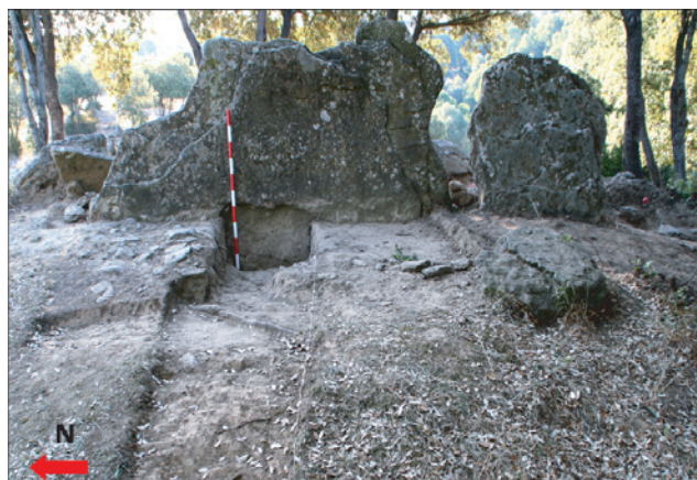
Figura 4. Vista est-oest del monument. S'observa el sondeig realitzat en el sector est del jaciment. També, a l'esquerra del jalón, s'observa el principi del paviment de pedres que queda tallat de manera natural pel sondeig.

Finalment, el sector oest del túmul és presenta més contrastos amb relació amb el sector est. D'entrada, no es documenta l'acumulació de pedres de grans dimensions que observàvem en el sector oest. Un element que crida l'atenció és el principi d'un paviment de pedres de reduïdes dimensions que sembla formar part d'una estructura més gran i que, per ara, encara no s'ha pogut excavar. De fet, i amb l'objectiu de visualitzar amb més detall la continuïtat d'aquest fenomen, es va realitzar un sondeig just darrera de les lloses laterals, però no es va documentar aquest paviment, que queda reservat únicament a la part nord d'aquesta zona (Figura 4). Destaca d'aquest sector un cert procés d'erosió que, segurament, ha buidat part d'aquesta zona del túmul, deixant el nivell per sota del que es documenta a la part est del túmul del jaciment. Esperem que els pròxims treballs arqueològics, permetin aclarir amb més detall aquestes diferències estructurals.