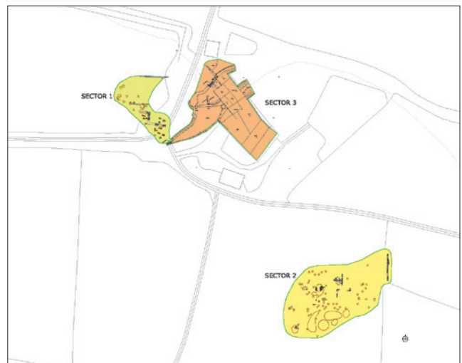
Figura 1. Sectors Jaciment el Graell

Can Claveres , unes 3 sitges que contenien ceràmica romana, teules i fauna al mas de Casa Fontcuberta (218 / 476 dC) i, finalment, l' Ermita de Sant Sixt de Miralplà , de final del segle XI, d'una sola nau a dues vessants de teula aràbiga.