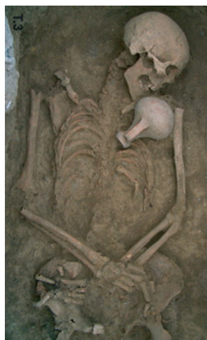
Figura 3a. Tomba 3

La T-3 és l'única amb estructura de coberta, encara que no l'hagi conservat en la seva major part. Només es conserva una tegulae , que formaria part de la caixa de la tomba, situada als peus de l'individu, marcant el límit inferior de la tomba. També conserva una part de la caixa de lloses, a la dreta de l'individu, realitzada amb pedres o còdols de mida mitjana. Es tracta d'una inhumació primària articulada d'un individu, possiblement masculí, amb les mans agafades que descansen sobre el pubis. Cal destacar l'aixovar, una peça sencera de ceràmica en la part superior esquerra de l'individu sobre el pit amb una gerreta de cocció oxidant coll alt, vora arrodonida i amb nansa, dipositada amb motiu d'ofrena. També s'han documentat dos claus de bronze a l'altura de les tíbies, que podrien haver format part de la indumentària o caixa de fusta que hagués pogut complementar l'estructura de tegula i pedres. (Figura. 3a).