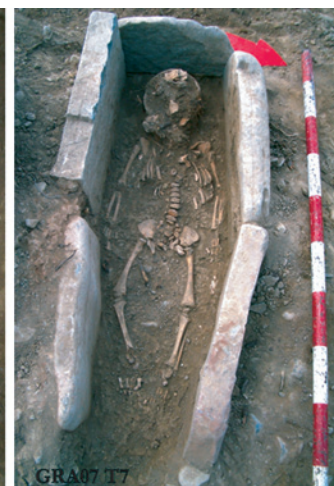
Figura 3b. Tomba 7

La T-5 és una fossa simple excavada a les graves amb un únic individu articulad. És possible que es tracti d'un masculí adult, d'edat indeterminada. A nivell gestual, el braç esquerre es troba uniflexionat al ventre. Algunes paleopatologies detectades en camp han permès constatar un húmer amb relleus molt forts de la musculatura dels bíceps, que denota activitat física del tronc superior o braços, i una lesió lítica de la part proximal de la clavícula dreta 6 . Els elements més característics són els objectes metàl·lics associats a l'individu: unes peces lonsàgiques de ferro, situades en la part superior dreta, a la mateixa alçada que el crani, que semblen ser parts d'una eina o una possible arma. L'altre element són la gran quantitat de rebladures o tatxes de ferro, que formarien part del calçat i que s'han documentat a sobre dels peus de l'individu. Cal destacar, també, la documentació d'un metacarp complet de Bos taurus .