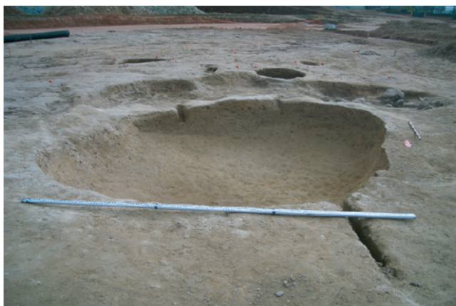
Figura 4. Conjunt R23 tardoantic

El molí fariner era un element quotidià en les comunitats pageses de l'alta edat mitjana. Com a recurs energètic per moure les moles de pedra que trituraven el gra s'utilitzava la força hidràulica. Fins a la fi de l'antic règim (s. XIX), en els grans dominis territorials de Catalunya, el senyor gaudia de monopolis sobre la propietat i l'explotació de certs serveis d'interès comú, com els molins, i aquests li representaven un bon ingrés, atès que el molí era d'utilització forçosa pels que vivien en el senyoriu. Aquestes instal·lacions varen proliferar al costat dels rius i rieres del país, com en el cas del molí de Sant Llorenç d'El Graell que té molt a prop el riu Mèder.